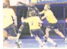
Un attacco dei frontalieri