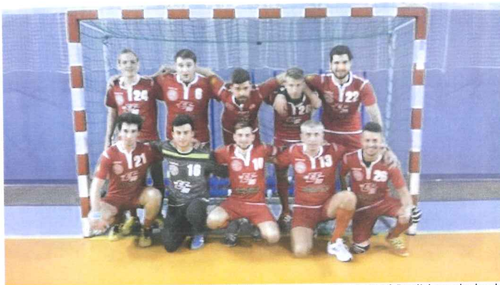
Nella foto la Seniores maschile dell'ABC Bordighera che ha sbancato Contes

I biancorossi sbancano il parquet transalpino e ottengono i primi tre punti della seconda fase. Il tecnico ci crede: “Vinciamo anche contro il Menton sabato sera”