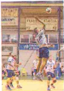
Lo Spinnaker è al «PalaBesio»

Alla ventesima giornata della B2 femminile, questa sera alle 21 alla Certosa di Pavia, la Iglina Ascensori Albisola si gioca il suo jolly. Virtualmente salva al momento, grazie al decimo posto, anche se con una sola lunghezza di vantaggio sulla Lilliput Biella, le «ceramiste» tentano un nuovo allungo che potrebbe essere decisivo. La squadra lombarda di cui sono ospiti, infatti, è la Colombo, cenerentola del girone con un solo punto all'attivo e la certezza di essere ormai retrocessa, assieme alle altre pavesi dell'Adolescere Rivanazzano.