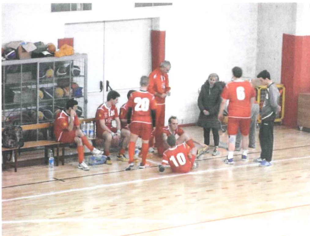
Nella foto la Seniores dell'ABC Bordighera, che ha superato l'AS Menton ed è in testa a punteggio pieno al girone francese

Il tecnico del sodalizio biancorosso analizza il match vinto contro i francesi: "Abbiamo fatto un brutto primo tempo, poi nella ripresa ci siamo divertiti"