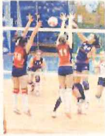
Il Carcare è di scena a Genova

Giocheranno invece in casa, domani alle 20, sia la Grafica Amadeo Sanremo, che a Villa Citera attende la Buttoumad Quiliano, sia lo Spezia Autorev, contro il Vgp Genova. Riposa la Maurina.