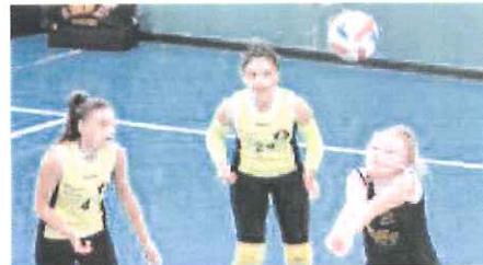
Le girls sanremesi impegnate in Val Bormida

Per la Maurina si tratta del ritorno in campo dopo la parentesi di sabato scorso caratterizzata dalla gara spostata ad Andora e non disputata per l'indisponibilità della pale-