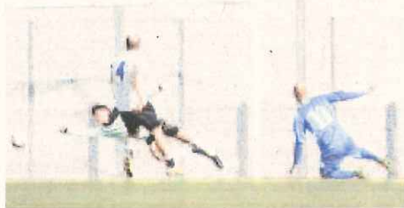
Il secondo gol dei triestini nel 2-2 dell'andata a Sanremo GIUSTO

UNIONE SANREMO: appuntamento con la storia. Oggi pomeriggio a Santa Croce di Trieste, i biancazzurri sono chiamati a una storica impresa, quella di accedere alle semifinali della fase nazionale della Coppa Italia di Eccellenza. Nessuna squadra della nostra provincia, finora, ci è mai riuscita. Sono arrivate al massimo ai quarti l'Imperia di Giancarlo Riolfo nella stagione 2005/2006 (eliminata dall'Esperia Viareggio che poi vinse il trofeo) e la Sanremese di Carlo Calabria nella stagione 2009/2010 (eliminata dal Bolzano, poi uscito in semifinale dal Tuttocuoio). IL 2-2