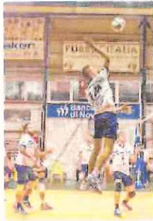
Lo Spinnaker è al «PalaBesio»

Alla ventesima giornata della B2 femminile, questa sera alle 21 alla Certosa di Pavia, la Iglina Ascensori Albisola si gioca il suo jolly. Virtualmente salva al momento, grazie al decimo posto, anche se con una sola lunghezza di vantaggio sulla Lilliput Biella, le «ceramistes» tentano un nuovo allungo che potrebbe essere decisivo. La squadra lombarda di cui sono ospiti, infatti, è la Colombo, cenerentola del girone con un solo punto all'attivo e la certezza di essere ormai retrocessa, assieme alle altre pavese dell'Adolescere Rivaravazzo.