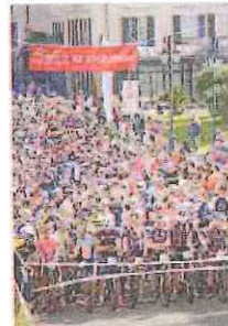
I partenti nel 2015: un boom

Il tracciato di 37,5 chilometri si sviluppa lungo le alture circostanti la Città del Muretto per chiudersi, dopo un tratto sul bagnasciuga, nella medesima location della partenza. «La Gran fondo Muretto di Alassio è ormai un classico, che ha vissuto