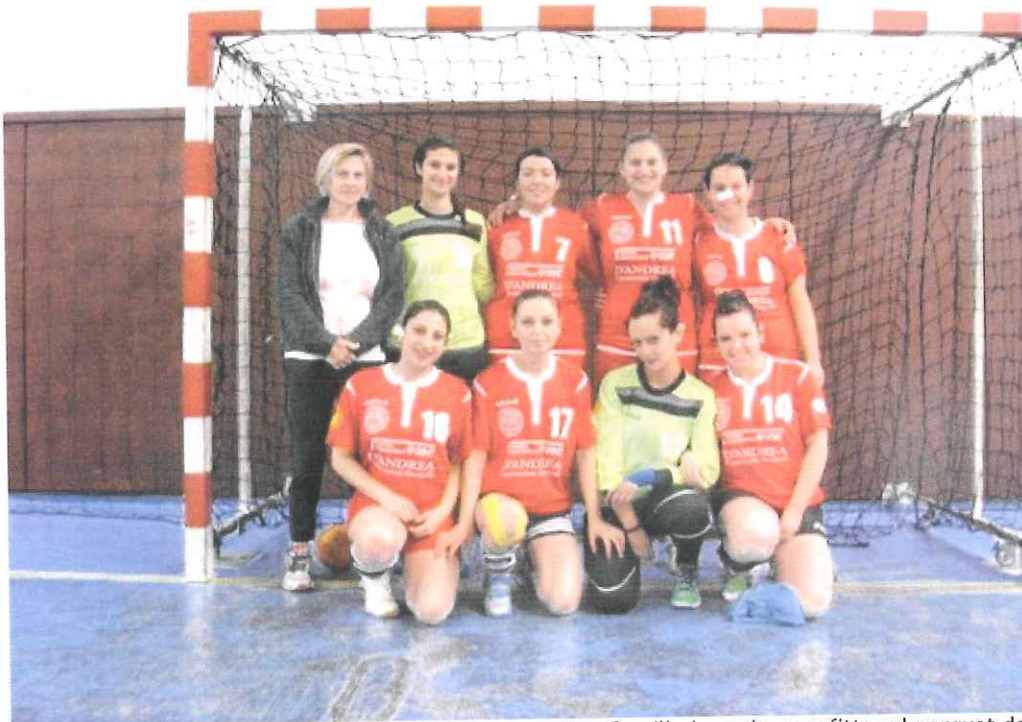
Nella foto la Seniores dell'ABC Bordighera/San Camillo Imperia, sconfitta sul parquet del Cavigal Nice

Tutto in salita l'inizio nella seconda fase del campionato territoriale francese per le atlete della nostra provincia che vestono il biancorosso