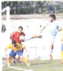
Cardini, grande parlita

L'Ardor Lazzate aveva la possibilità di chiudere il primo tempo in parità quando, a un minuto dalla fine della prima frazione di gioco, le veniva