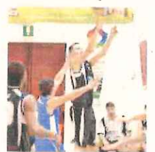
L'Albenga in azione a canestro