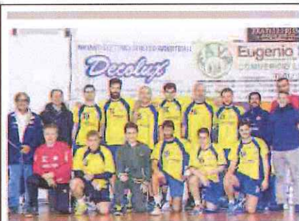
La squadra seniores dello Schiavetti Imperia di scena in Francia

■ In attesa che domani si giochi, per l'Eccellenza, il recupero tra Cairese e Magra Azzurri, i riflettori della Prima categoria si accendono stasera per due delle quattro partite che mancano ancora all'appello. Alle 20, al Brin di Cairo, ad aprire il programma è Pallare-Bordighera S. Ampelio, con i padroni di casa decisi a incamerare tre punti che li riporterebbero in scia al Ceraie. Alle 20,45 al Corrent di Carcare, toccherà a Millesimo e Pontelungo, scontro tra la cenerentola del girone e una compagine ospite che ha la salvezza a portata di mano. Rimarranno da recuperare le due gare saltate domenica, ossia Altarese-Millesimo rinviata per il maltempo, e Ospedaletti-Bordighera non giocata per il lutto che ha colpito la squadra ospite. Inizia anche il programma del girone B di Seconda. Oggi alle 20,30 Murialdo-Plodio e Rocchettese-Mallare; domani alla stessa ora si giocano invece Cengio-Aurora e Olimpia Carcarese-Calizzano. [6.C.]