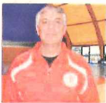
Malatino: imparare dai francesi

Non basta l'orgoglio, soprattutto se fatto dalle ingiustizie. Finisce contro il Cassano Malatino il 19 marzo per 28-22 sabato sera al PalaRipa nell'ultima di andata della Poule Promozione, le ambizioni della Pallamano Ventimiglia di centrare un posto sul podio della A2. Nonostante la bella prestazione, in una splendida cornice di pubblico e in un incontro che non si è certo deluso, i frontalisti si sono dovuti arrendere con i tempi, nonostante l'aver avuto tempo, concluso il recupero dai gialloneri di Zaborna per 12-11.