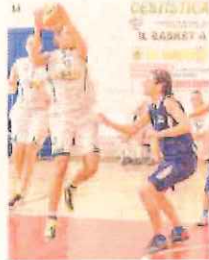
La Cestistica sogna ancora

Savonesi a Lavagna nelle semifinali di B, il team di Vado e Loano ha il Tigullio