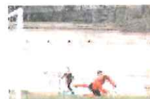
La rete realizzata da Sinisi