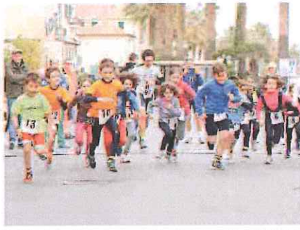
Molti tra i piccoli si sono cimentati per la prima volta nel duathlon

Dopo le prove delle categorie giovanili Bambini, Esordienti e Ragazzi, dove a farla da padrone dono stati gli atleti di Riviera Triathlon 1992, Zena Tri Team, Virtus Acqui