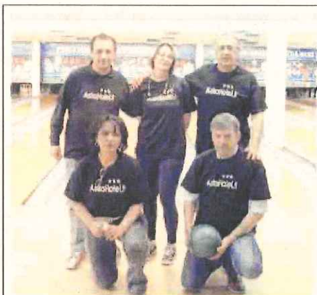
La squadra dell'Astrahotel.it che lunedì sera si giocherà il titolo