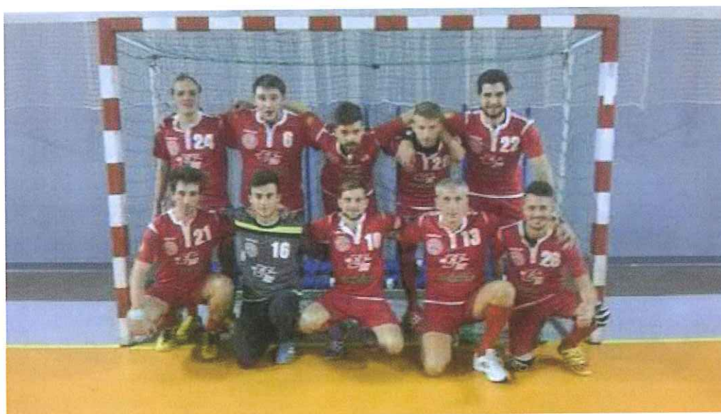
Nella foto l'Under 18 maschile dell'ABC Bordighera