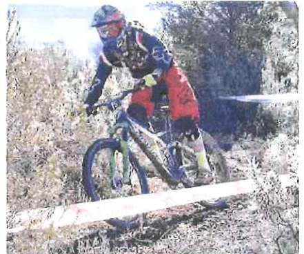
Ecco in azione Fregona, sedicesimo e quarto tra i Master M1