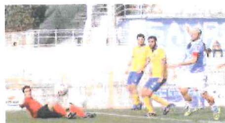
Il portiere dei lombardi respinge tiro di Bregliano

L'Unione Sanremo giocherà i quarti di finale (turno secco con gare di andata e ritorno) contro il Vesna, formazione del Friuli Venezia Giulia che ha