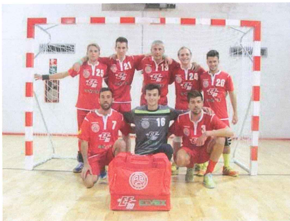
Nella foto la Seniores maschile dell'ABC Bordighera

Superati in scioltezza i francesi del Mougins Mouens-Sartoux (32-20) e il tecnico dei biancorossi è entusiasta: “Grande prova globale”. L’Under 18 maschile cede alla Rappresentativa di Nizza (19-32)