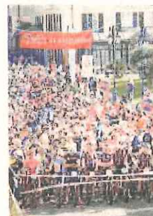
I partenti nel 2015: un boom

Il tracciato di 37,5 chilometri si sviluppa lungo le alture circostanti la Città del Muretto per chiudersi, dopo un tratto sul bagnasciuga, nella medesima location della partenza. «La Gran fondo Muretto di Alassio è ormai un classico, che ha vissuto