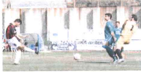
Il numero uno piemontese respinge un altro tiro