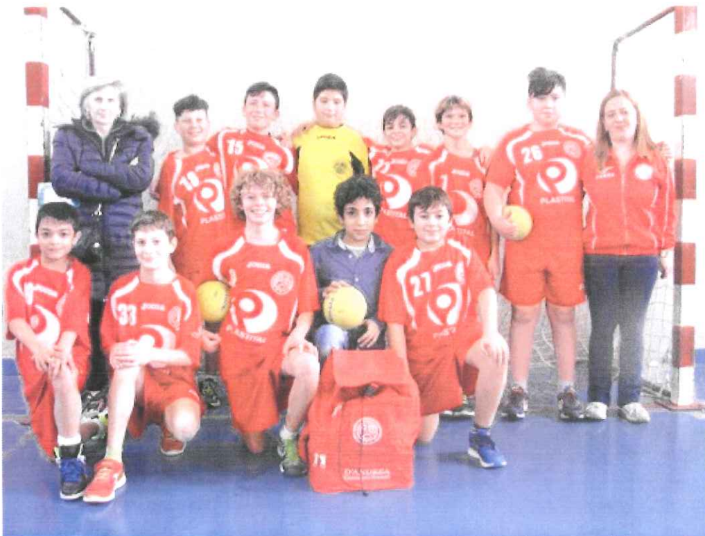
Nella foto i baby atleti dell'ABC Bordighera, categoria Under 14

I baby atleti del sodalizio bordigotto avranno un duro appuntamento nel capoluogo ligure. Le partite in programma saranno contro i pari età del San Camillo Imperia e contro l'Under 12 Ventimiglia