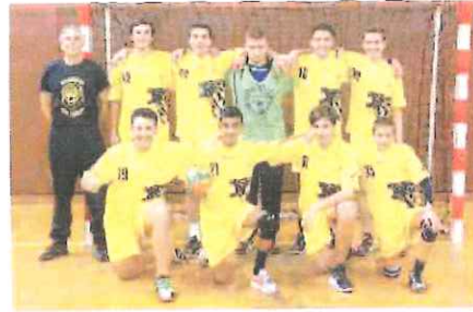
L'Under 16 del Ventimiglia, travolgente anche nell'Interregionale

È proseguita, intanto, la serie positiva della Under 14 maschile della San Camillo Imperia, che, nella seconda fase del campionato france-