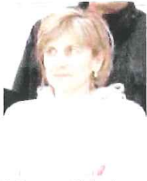
La Germano guida la «mista»

La partita è rimasta in equilibrio solo nel primo tempo (14-12), che comunque ha sempre visto i bordigotti in vantaggio. I biancorossi