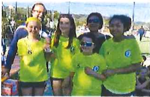
La squadra vincitrice del Vallecrosia Green

Dopo 19 edizioni, giustamente, un torneo deve essere considerato un appuntamento più che tradizionale, anche se a disputarlo sono atleti ed atlete giovanissimi che si stanno affacciando solo ora al mondo dello sport. È questo il caso di «Palla in... Centro» che appunto da 19 volte richiama a Diana il meglio del minivolley provinciale e non solo. Ancora una volta ad accogliere l'evento è stato il Bowling di Diana che domenica scorsa ha visto un'agguerrita ma sempre amichevole competizione che, come abitudine, segna l'arrivo della bella stagione e dell'attività all'aperto del minivolley.