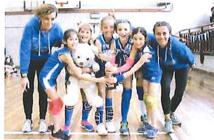
Le Under 10 della Maurina campionesse regionali e di simpatia

Le «maurine», inserite nel girone B provinciale, dopo uno splendido percorso netto, hanno affrontato sabato 6 maggio alla Ruffini di Imperia nella prima semifinale la formazione «Gialla» della Sant'Antonio Genova, superata con un netto 3-0: nella successiva finale, la Maurina si è imposta, sempre per 3-0 sulla Sant'Antonio «Arancio», che nell'altra semifinale aveva avuto la meglio, per 2-1, sulla Scuola di Pallavolo Mazzucchelli