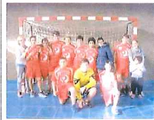
Bordighera La squadra Under 14 dell'Abc che battendo il Grasse si è confermata in vetta al campionato Honneur francese