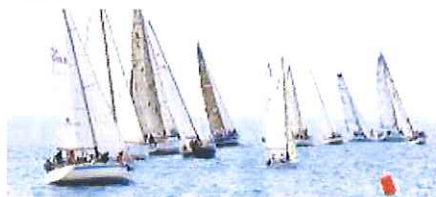
Una regata davanti al porto di Marina degli Aregai