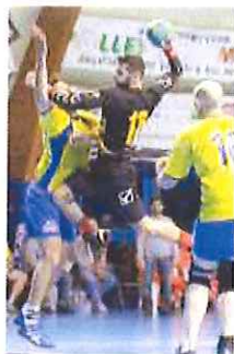
Ventimiglia in attacco

Ultimo in ordine di tempo è il successo centrato dai ragazzi dell'Under 16, anch'essi impegnati in un campionato gestito dalla federazione