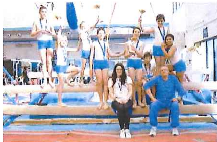
I giovanissimi atleti dell'artistica maschile della Riviera dei Fiori

A seguire si è svolta la gara di minitrampolino pari, una delle novità agonistica di uno «strano anno», non sempre