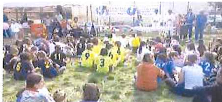
Un momento della manifestazione

Sono stati coinvolti in una doppia manifestazione sportiva, incastonata nella fase conclusiva della stagione agonistica.