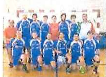
Il Team Schiavetti S. Camillo

Grande festa, sabato scorso, per il 50° anniversario di attività della San Camillo Imperia di pallamano. L'occasione per celebrare l'importante ricorrenza, di mezzo secolo di sport e passione, è stato il Torneo Internazionale "Padre Chiaffredo Peyrona", fondatore della società nel lontano 1967. La manifestazione si è articolata su due campi, con partite al Palazzetto dello Sport di Imperia, dove sono scesi in campo le formazioni Senior, e al PalaSanCamillo, dove le protagoniste sono state le ragazze della categoria Under 18. Alla competizione maschile hanno preso parte i