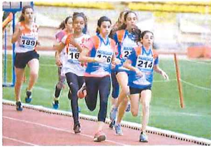
Un momento delle gare monegasche, ricche di giovani ponentini

Da tempo la magica pista dello stadio Louis II, a Montecarlo, è un tracciato che esalta le capacità e risveglia la determinazione dei podisti ponentini. Ne è un esempio tradizionale la massiccia e qualificata partecipazione alla prova sui 1000 metri organizzata in estate in occasione del Meeting internazionale Herculis. Questa buona nomea si è rinnovata nei giorni scorsi, grazie alle ottime prestazioni fornite da molti giovani della Foce di Sanremo in occasione di un'importante competizione che ha richiamato ai blocchi di partenza anche i migliori rap-