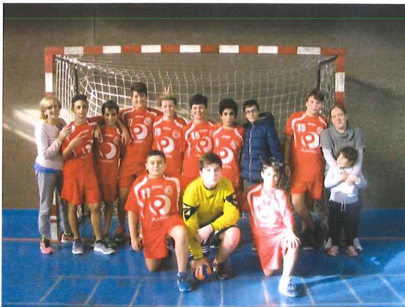
Nella foto l'ABC Bordighera targata under 14

Campioni di categoria i francesi dell'AS San Martin du Var vincenti sui baby biancorossi per 21-20