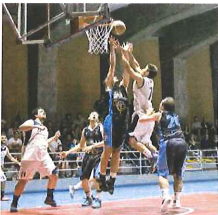
Un attacco sotto canestro della Compass Imperia

I giocatori dell'Imperia con grande determinazione hanno effettuato una splendida rimonta nelle ultime giornate di campionato, agguantando in extremis un settimo posto