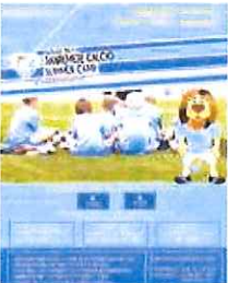
Il manifesto dell'iniziativa

180 euro. Se i bimbi per famiglia sono due il costo è di 180 euro, più 140 per il secondo figlio. Entrambe le settimane per un bambino: 300 euro. Il costo dell'iscrizione comprende pranzo, merenda pomeridiana e un kit di abbigliamento: due magliette da gioco, due pantaloncini, calzettini, una maglietta per il tempo libero, una sacca ed un cappellino. Per iscriversi occorre telefonare ai numeri: 0184-666070, 0184509446, 349-3953700. Oppure man-