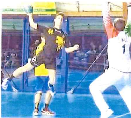
Il ventimigliese lorio in azione: battuto 24-21 il Vence/Milleneuve

I padroni di casa avevano preparato la gara alla perfezione e sono stati all'altezza dei gialloneri che, per contro, in avvio non sono riusciti a trovare lo smalto di altre occasioni e per lunghi tratti hanno subito la disposizione difensiva degli avversari. Il pri-