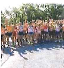
La partenza della corsa