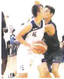
L'Imperia è salita in vetta alla D

A due sole lunghezze inseguce l'Auxilium Genova. Più staccato il resto della concorrenza, anche per la sconfitta della Fortunato (77-70 in casa con l'Alcione Rapallo) e dell'Amatori piegata 69-49 dal Villaggio Chiavari. Riposava