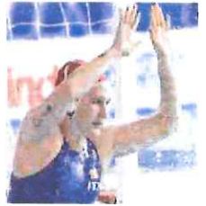
La Gorlero, azzurra imperiese

Un'Italia che asfalta le malcapitate avversarie, anche per merito delle tre imperiesi in acqua, un Rari Nantes che arancia ma che prova a sperare: momenti diametralmente opposti nella pallanuoto azzurra e giallorossa, quando all'orizzonte, per entrambe le squadre, si avvicinano le partite decisive.