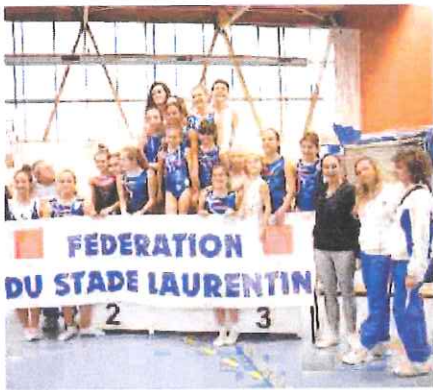
La squadra della Riviera dei Fiori impegnata nel Trofeo Challenge

Alla gara erano presenti i ginnasti di Etoile Monaco, Oajp Antibes, Kelotrampo S. Laurent du Var e, per la Liguria, della Riviera dei Fiori. Due i livelli tecnici previsti, quello riservato ai ginnasti