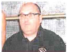
Alla finestra Lupi e Ospedaletti

Nella serie C Silver maschile, il Bc Ospedaletti è fermo per il riposo e l'attenzione, nel Ponente, si concentra così sull'Azimut Pool 2000 Loano