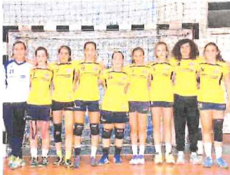
Le Under 16 dello Schiavetti Imperia hanno battuto la Vallis Aurea