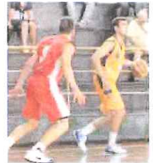
L'Ospedaletti gioca nel Tigullio

Si chiude domani l'andata della D maschile, con tre squadre in lotta per il titolo d'inverno (Albenga, Busalla e Valpetronio Casarza Ligure) e una (l'Imperia) staccata di soli due punti. Il 13° turno vede gli inguami ospiti alle 19 della Rari Nantes Bordi-