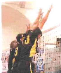
Un 3-0 per la Grafiche Amadeo

grazie a successi interni, il Golfo di Diana (3-0 al Celle Varazze) e la Soccerfield Loano (3-1 alla Nlp Sanremo). Sconfitte interne per 3-0 per la Vitrum & Glass Carcare con la capolista Virtus (parziali però molto combattuti), e per l'Armataggia ad opera del Cogoleto.