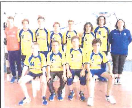
L'Under 14 del Team Schiavetti è prima con 8 punti di vantaggio

È andata invece male nel doppio. La coppia formata da Fabio Fognini e dallo spagnolo Pablo Andujar è stata subito sconfitta per 6-3 6-4 dal duo statunitense composto da Steve Johnson e Sam Querrey.