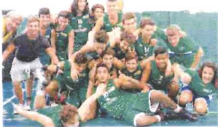
La formazione Under 15 del Bvc Sanremo in festa dopo la vittoria

Nulla da fare, invece, per i pari età del Bc Ospedaletti, sconfitti dal Basket Loano per