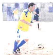
Gervasi del Ceriale capolista

Due autentici spargi salvezza vanno in scena poi al Borel, con Città di Finale-Celle Ligure, e al Corrent di Carcare, con Millesimo-Speranza Savona. A rischiare di più, anche perché già in cattive acque, sono senza dub-