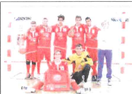
La compagine Under 18 dell'Abc Bordighera vittoriosa a Nizza