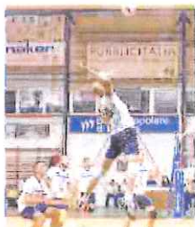
Spinnaker in cerca del «pieno»

Mentre la Maurina Strescino Imperia alle 21 è a Voltri, ospite della Volare Arenzano, alla stessa ora la Ruttonmad Quiliano cercherà di ottenere punti salvezza ospitando a