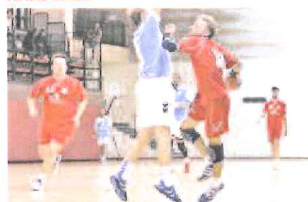
L'Abc Ventimiglia ha iniziato bene il 2016