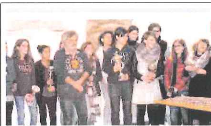
I giovani della Foce, premiati per le vittorie conseguite nel 2015

IN PRIMO PIANO L'ATLETICA LEGGERA SANREMESE