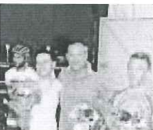
Il podio con i vincitori