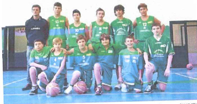
L'Under 15 del Bvc Sanremo capolista nel torneo regionale: per il club matuziano bene pure l'U17 Elite