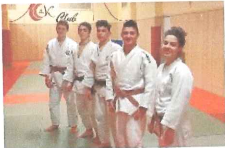
I cinque atleti che l'Ok Club schiererà a Ostia, nei Nazionali Cadetti

L'Ok Club ha schierato nell'occasione una squadra di nove judoka, pronti a dare il meglio di sé per ottenere il biglietto per una finale nazionale. Prime a scendere in gara sono state le categorie femminili nelle quali erano impegnate