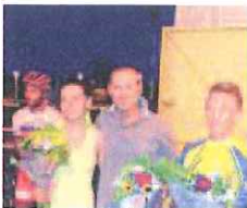
Il podio con i vincitori