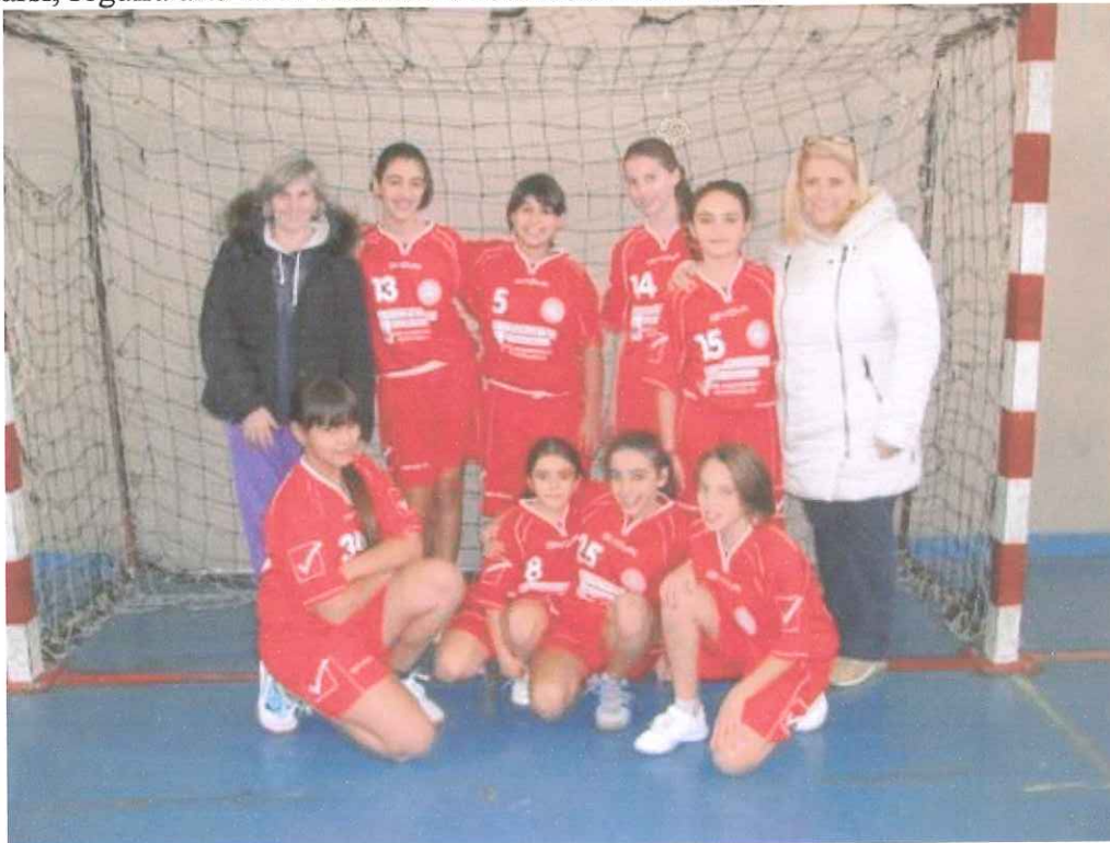
ABC Bordighera Under 14 Femminile

- Entrambe le partite sono valide per il campionato provinciale. Alle 15 saranno le squadre maschili a confrontarsi, seguirà alle 16 la sfida tra le formazioni femminili