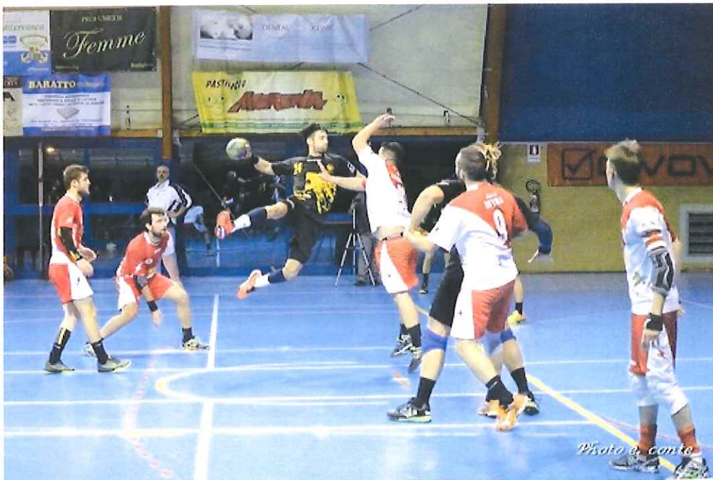
L'ABC Bordighera sta disputando una grande stagione di Serie B

Sabato grande sfida in terra piemontese per la compagine biancorossa