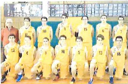
La formazione Under 16 del Bc Ospedaletti vittoriosi contro il Vado