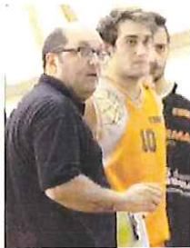
Lupi è il coach di Ospedaletti

Ancora più devastante del solito. La Tank Cleaning Cestistica Savonese, assoluta dominatrice della stagione regolare della C femminile di basket, nella quale ha incassato 18 vittorie in altrettanti confronti, non si è smentita nemmeno nell'andata delle semifinali e sabato sera, al Palasport Pagnini di Savona, ha strapazzato le avversarie dell'Audax San Terenzo Leric, sconfitte con un roboante 90-25. Il confronto di ritorno è previsto venerdì alle 21,15 a Leric e le biancoverdi puntano a chiudere la contesa in due soli atti, senza dover ricorrere all'eventuale bella che sarebbe in programma il 22 marzo, nuovamente al «Pagnini». Nell'altra semifinale la Polysport Lavagna ha superato per 58-41 la Nba New Basket A-Zena.