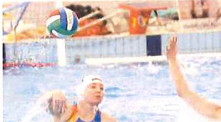
Ci sarà bisogno della miglior Stieber per superare le avversarie

ATTUTITO l'impatto per il ko partito domenica alla "Cascione" dalla Florentia, scivolata nel frattempo al terzo posto della classifica, scavalcate anche dal Como, le giallorosse di Paolo Ragosa torneranno domani in vasca, per la seconda volta consecutiva in casa, per affrontare (ore 12, arbitro Alberto Rovida) la formazione genovese della Locatelli. Il cliente, in occasione della prima giornata di ritorno del campionato femminile di serie A2 di pallanuoto, non è dei migliori. Caratteristica della Locatelli è la combattività che rende, unitamente ad pizzico di spaval-