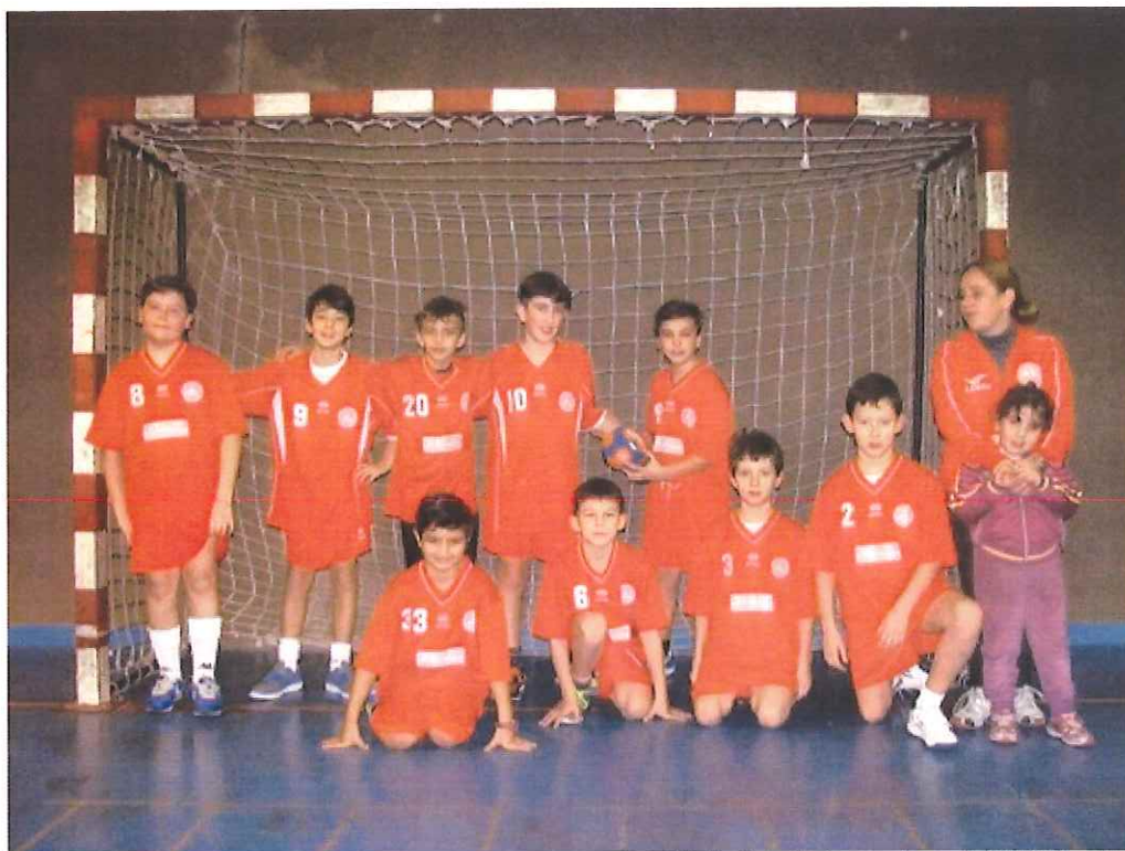
Nella foto la formazione dell'ABC Bordighera under 12

La formazione under 12 ha partecipato al 5° Concentramento di categoria ad Imperia