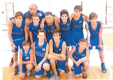
Il Sea Basket Sanremo Under 15 ha già in tasca il pass per le finali