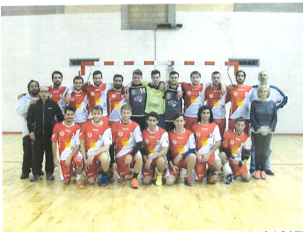
Volo in Serie B dell'ABC Bordighera

La formazione under 14 supera di misura il Carros