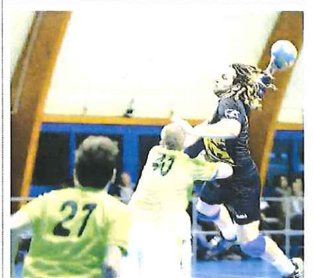
Un attacco del Ventimiglia, capolista della serie B col Valpellece

Si è conclusa la stagione regolare della D femminile. Ai playoff la capolista Gabbiano Andora, Maurina Strescino Imperia, Cogoleto, Celle Varazze e Carcare. Ai playoff, nonostante l'essere arrivata appaiata alle carcaresi, l'Albisola che lotterà per la salvezza con Nlp Sanremo, Golfo di Diana, Olympia Voltri e Loano. Per la D maschile, nei playoff tre successi per 3-0: quello interno del Celle Varazze sull'Olympia, quelli esterni della Colombiera Sarzana ad Alassio e della Spotonense in casa della Barbudos Albenga. Nei playoff male il Maremola Pietra: 0-3 a Rapallo. [G.C.]