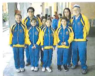
Avanti così I giovani arcieri di San Bartolomeo che erano in gara a Genova per la fase regionale invernale del Trofeo Pinocchio