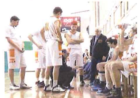
Il coach Lupi catechizza i suoi ragazzi