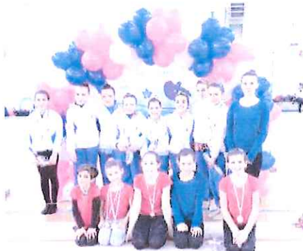
Soddisfazioni per la Riviera: ecco il gruppo della sezione di Taggia

Quattro le gare svolte (dalla 4a alla 1a divisione) e cinque le categorie dei ginnasti coinvolti, quattro delle Allieve e una Juniores, nel complesso dagli 8 ai 13 anni. Le ginnaste si sono sfidate in pe-