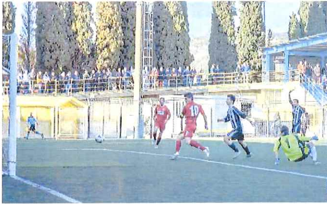
Nella foto di Enrico Testa, il 2-1 di Alessi all'Albenga: l'Albissola sembra ormai volare verso la serie D