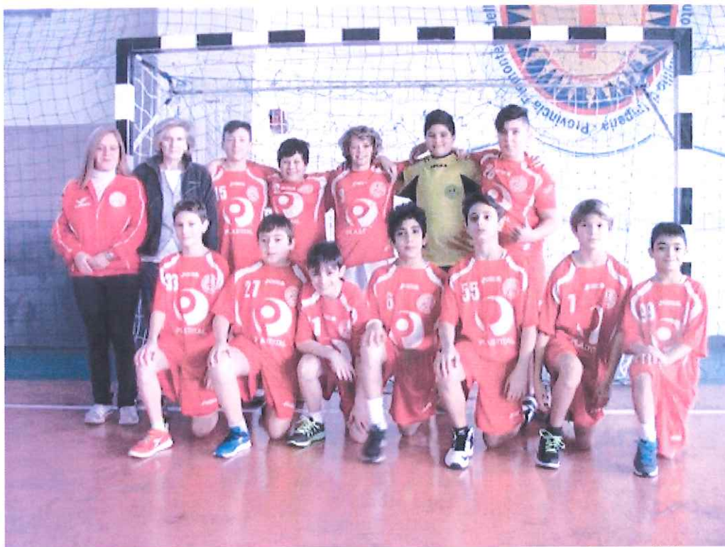
Nella foto l'ABC Bordighera targati under 14

Domani sul parquet di La Spezia sfida al team locale under 16. Tutti gli appuntamenti della settimana