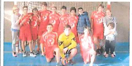
Gli Under 14 dell'Abc Bordighera sono primattori in campionato

Agrodolce Ecco gli Under 18 del Bc Ospedaletti che dopo aver battuto il Maremola con autorità si sono arresi in casa al Loano