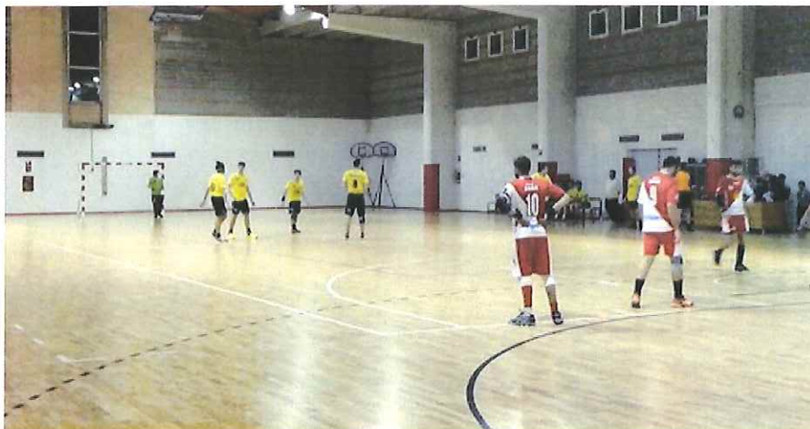
Sconfitta interna per l'ABC Bordighera contro il Valpellice

I piemontesi sbancano il parquet dei biancorossi che combattono fino all'ultimo minuto