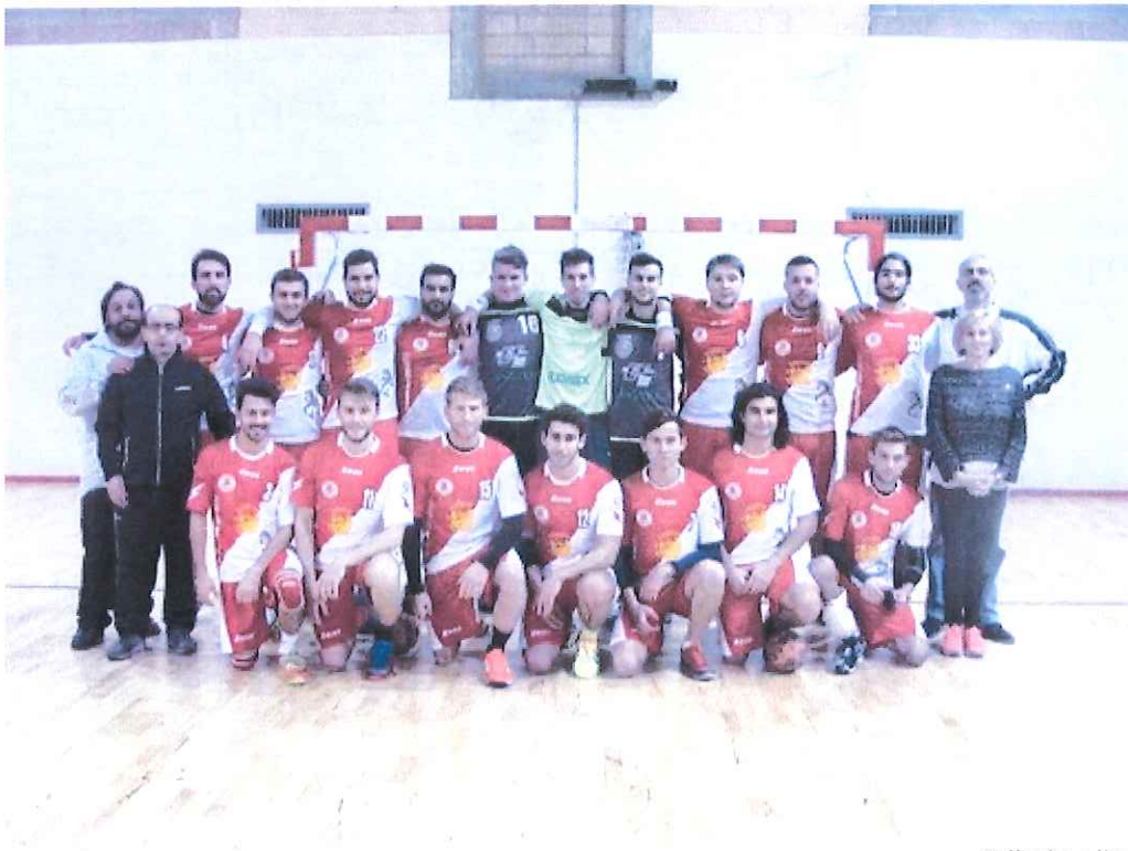
Nella foto l'ABC Bordighera

Recupero della prima giornata al PalaBiancheri (ore 18.30)