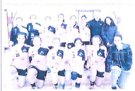
Le ragazze della Riviera Imperia battute di misura dal Raluca