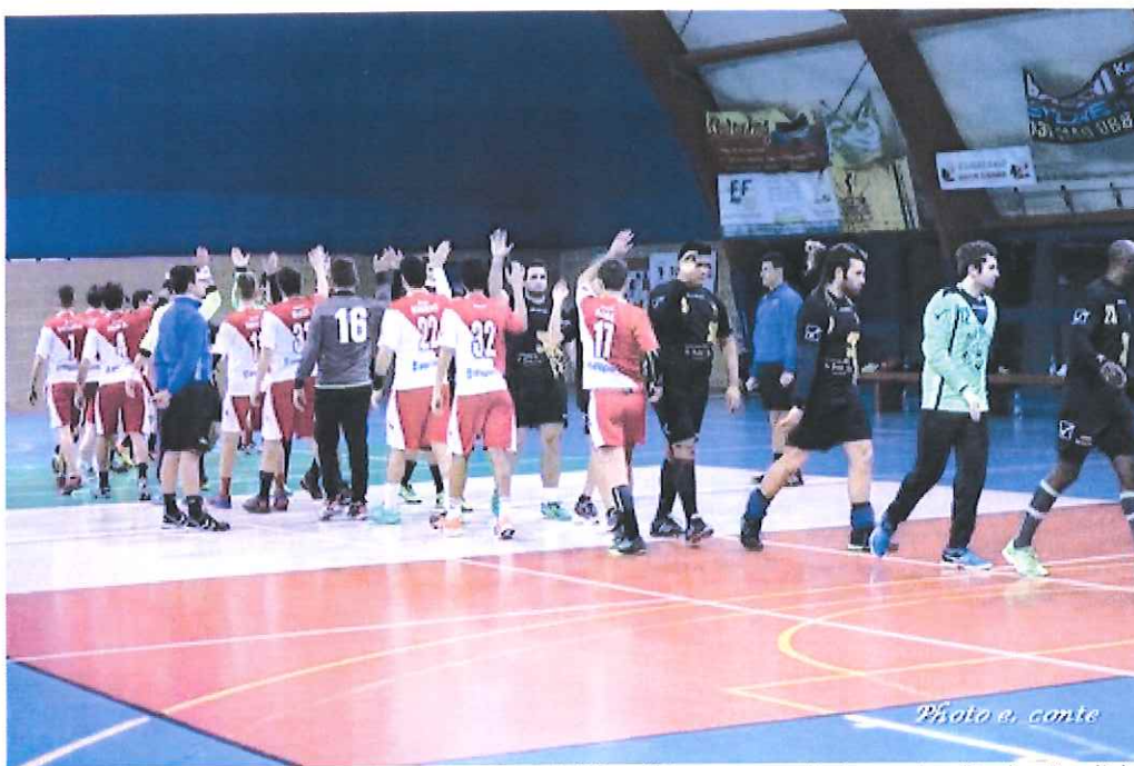
Pallamano Ventimiglia e ABC Bordighera presenti al progetto "Bacino Bordighera-Levanto6"

Domani di l'evento si svolgerà presso la sala Rossa del Palazzo del Parco