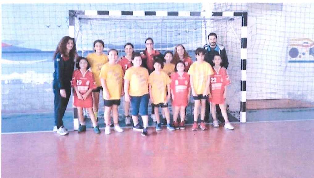
Grande divertimento per i baby atleti dell'ABC Bordighera al Concentramento under 12

Si avvicina per la Seniores il big-match contro il Valpellice