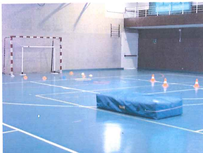
Tutto pronto alla palestra Conrieri di Bordighera per il secondo baby-hand in programma sabato

Dedicato ai bimbi dai 3 ai 7 anni. Tutte le informazioni