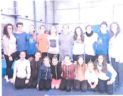
La selezione azzurra di Teamygym comprendente cinque ponentini

Un impegno ulteriore per un sodalizio che, come la Ginnastica Riviera dei Fiori, è attivo in tutte le quattro sezioni olimpiche. L'esordio stagionale sarà la prima prova del Campionato regionale Silver di ritmica, cui la Riviera dei Fiori prenderà parte con 18 atlete e che vedrà il club ponentino anche nelle vesti di organizzatore, per l'evento previsto sabato alla Palestra