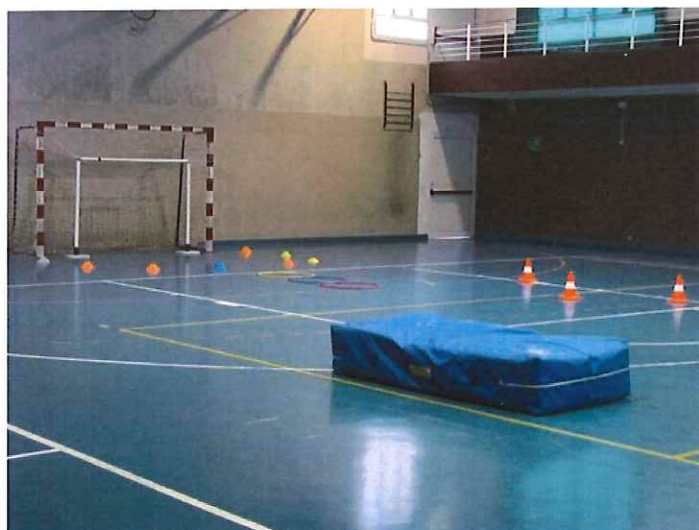
Secondo grande appuntamento domani mattina alla palestra Conrieri di Bordighera per il Baby-Hand

La grande iniziativa della società biancorossa in programma alla palestra Conrieri