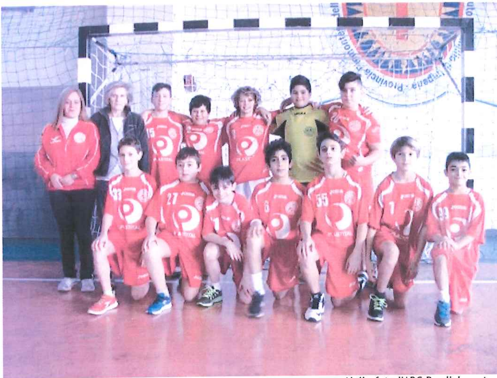
Nella foto l'ABC Bordighera targata under 14

Appuntamento alla Palestra Conrieri. Ieri si è svolto il Comitato delle Alpi Marittime. Alle ore 18.30 in campo gli under 14 contro il San Camillo Imepria