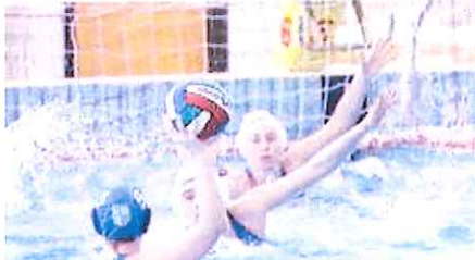
La difesa giallorossa qui impegnata con il Promogest GIUSTO