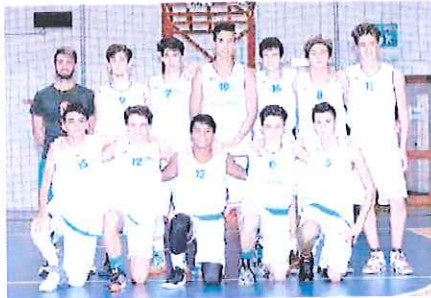
Bene anche il Bvc Sanremo Under 16 che ha travolto il Loano

«L'Imperia - ha sportivamente riconosciuto il coach