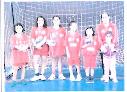
Le Under 12 dell'Abc Bordighera che erano di scena alla Conrieri