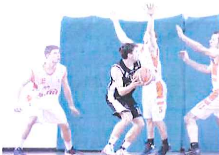
Gli "orange" sono attesi a una gara a tutta grinta

Serie D maschile. La Compass Imperia Riviera dei fiori, tornata al successo dopo un lungo periodo di digiuno, ha l'opportunità di avviare una striscia positiva di risultati: domani alle 18.30 al Palamarco affronta i padroni di casa