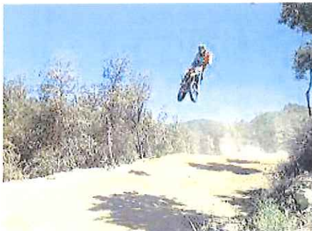
La pista di motocross di Beuzi

Dalle 8 di domenica fino a fine iscrizioni si svolgeranno