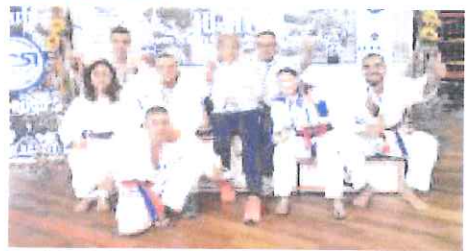
La formazione ju jitsu del Sakura Arma