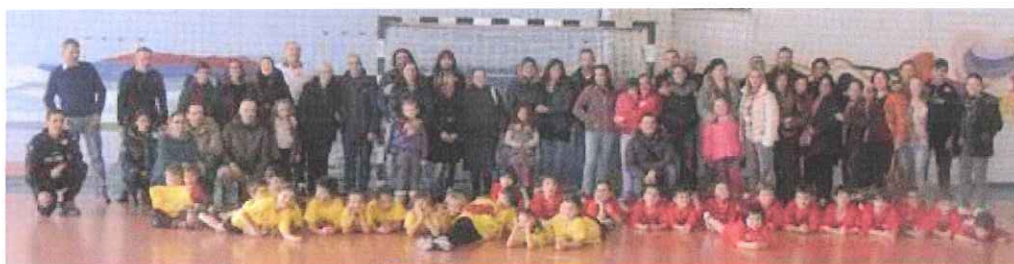
Nella foto il Gruppo Sportivo targato ABC Bordighera

Vista la sosta di tutti i campionati agonistici, alla Palestra Conrieri, gli atleti biancorossi contro il San Camillo Imperia