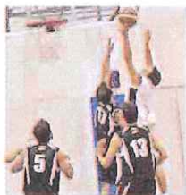
L'Albenga promossa in C Silver

Ultimo turno della stagione regolare, invece, per la serie D. La già promossa Albenga nella passerella finale ha regolato per 90-54 il finalino di coda Rari Nantes Bordighera. Accesa la lotta per i playoff, con l'Im-