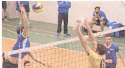
L'attacco del Primavera non ha funzionato