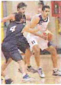
L'Imperia vuole i playoff di D

Battute finali nei campionati di basket. Per la B femminile, mentre Polysport Lavagna e Torino Teen si giocano la promozione, la Cestistica Savonese, domani alle 18, affronta la prima gara della finalina per il 3° e 4° posto sul campo piemontese della Polisportiva Pasta. La sfida, al meglio delle due vittorie su tre incontri, si ripeterà poi mercoledì 6 alle 21,15 al Palasport Pagnini e, eventualmente, per la «bella», sabato prossimo nuovamente a Rivalta di Torino.