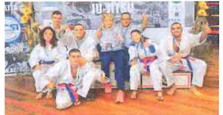
La formazione Ju Jitsu del Sakura Arma