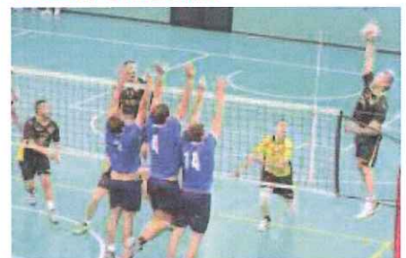
Un attacco a rete del Grafiche Amadeo Sanremo GIUSTO