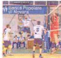
Lo Spinnaker è di scena a Chieri

Iglna e Spinnaker vicine alla salvezza, le valligiane possono conquistare la B2