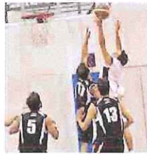
L'Albenga promossa in C Silver

Ultimo turno della stagione regolare, invece, per la serie D. La già promossa Albenga nella passerella finale ha regolato per 90-54 il fanalino di coda Rari Nantes Bordighera. Accesa la lotta per i playout, con l'Im-