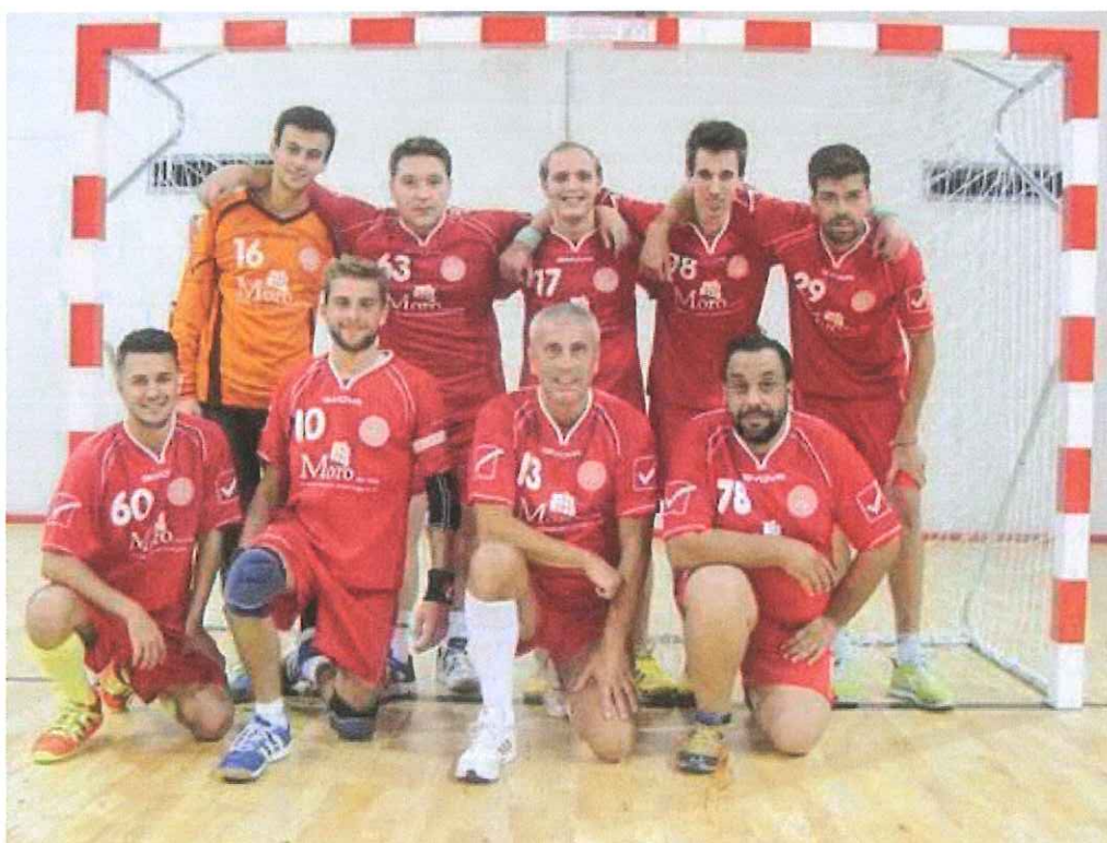
Nella foto la Seniores maschile dell'ABC Bordighera