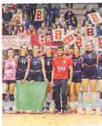
Uno scatto della festa a Carcare

Ultimi scontri nel campionato femminile di C. Con l'Acqua Minerale Calizzano Carcare «storicamente» promossa da sabato sera col volley valligiano in trionfo, la domenica ha portato la vittoria della Grafiche Amadeo per 3-1 (25-18, 21-25, 25-20, 25-18), nel derby con la Maurina Strescino. Con questi tre punti le sauresi hanno scavalcato le cugine, portandosi al sesto posto. Fine di stagione in calo, con spazio alle seconde linee, per la Ch4 Caldaie Albenga, piegata a domicilio, 3-1, dalla Volare Arenzano.