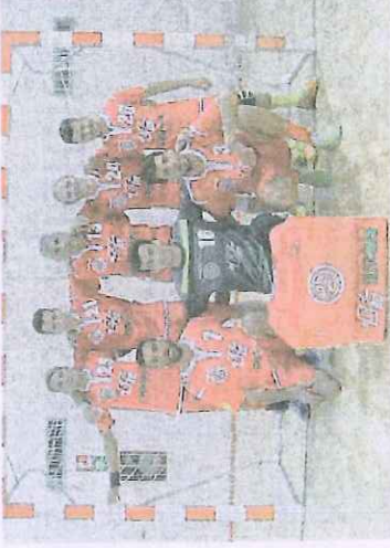
L'ABC BORDIGHERA costretta a un pareggio che le sta stretto dall'Antibes e da una discutibile gestione degli ultimi secondi di gara da parte degli arbitri