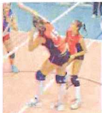
Il Carcare è in volo verso la B2

Nulla da fare, a Chieri in casa della Nuncassfoglia capolista della B2, per lo Spinnaker Albisola. I rivieraschi, davanti a una formazione lanciata verso la promozione, si sono dovuti arrendere con il punteggio di 3-0, riuscendo a contrastare egregiamente il passo ai titolati avversari solo nel secondo set, terminato con la vittoria dei piemontesi per 27-25. Più netto il divario nel primo e nel terzo set, chiusi 25-13 e 25-19.