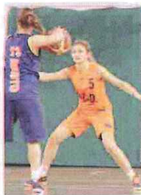
Le ragazze di Ospedaletti al top

Tira il fiato il team di Loano e Vado, in C la D lancia l'Imperia