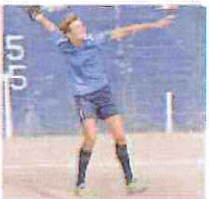
Grasso, del Valli del Ponente

In B la Canalese, nella terza giornata espugna lo sferisterio di Bormida e conquista la vetta solitaria a punteggio pieno. Sulle tribune dello sferisterio Pertini Mayoreca oltre 400 tifosi ad assistere al big-match: i canalesi si sono imposti per 11-4. Da segnalare che nella quadretta locale, capitanata