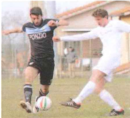
L'assenza della punta Cardini è pesante

sente di andare in finale, non solo vincendo, ma anche con un pareggio senza reti. In caso di pareggio con 2 reti o più saranno i marchigiani a passare. In caso di pareggio per 1-1, saranno battuti i calci di rigore. La finalissima della Coppa Italia si giocherà in campo neutro mercoledì 20. L'Unione Sanremo dopo aver perso il derby casalingo con l'Imperia per 1-0 ed esser scivolata a 6 punti dalla capolista Finale a tre giornate dalla fine, punta le proprie fiches sulla promozione diretta in D tramite la Coppa, dato che chi vince questo trofeo è promosso al di là del piazzamento in campionato. A Fabriano il 25 marzo Dalessandro aveva portato in vantaggio i biancazzurri al 43', ma