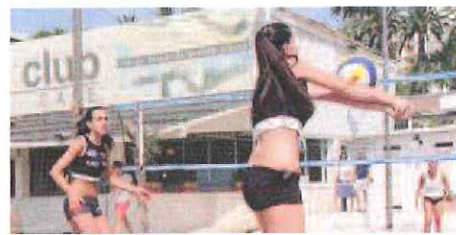
La città dei fiori di nuovo capitale del beach volley