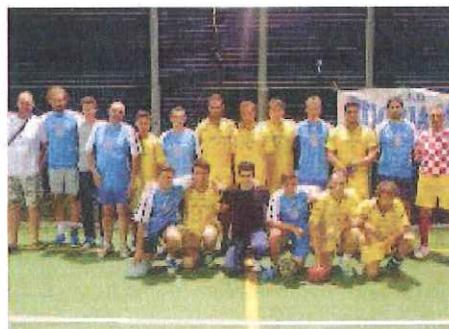
Foto di gruppo per le due squadre finaliste del Torneo di Seborga