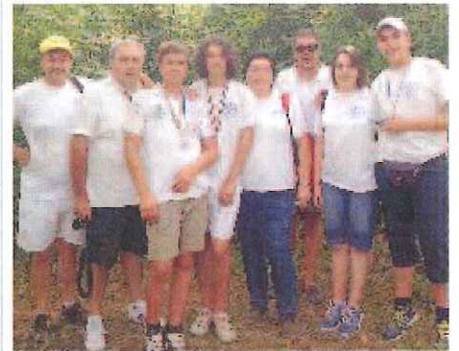
Il gruppo degli Arcieri di San Bartolomeo che era agli Italiani