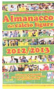
La copertina dell'Almanacco

Un'ulteriore particolarità che va ad impreziosire una pubblicazione ormai tradizionale in ambito ligure. Tutte le pagine sono a colori dalla serie A alla Terza Categoria, passando attraverso Serie B, Lega Pro, Serie D, Eccellenza, Promozione, Prima e Seconda Categoria. Ogni società è raffigurata con il proprio stemma ufficiale, la foto di squadra e tutte le figurine a mezzobusto e a colori di dirigenti, tecnici e giocatori. Confermato l'effetto figurina degno dei grandi Album Panini, per una pubblicazione unica nel suo genere in Italia. Alla completezza dell'apparato fotografico (svariate migliaia le foto pub-