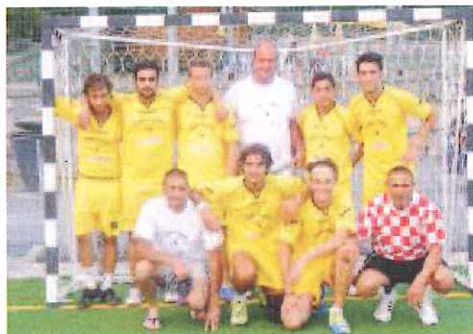
La rosa al completo di "Voglia di gelato"

Suddivise in due gironi da tre, le sei squadre in lizza hanno dato vita