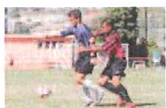
L'ultimo derby tra Argentina e Imperia

AL DI LÀ della Coppa Italia, sono stati già varati i gironi dei vari campionati dilettantistici liguri di Eccellenza, Promozione e Prima Categoria. Per quanto riguarda quest'ultimo campionato, c'è ancora qualcosa da definire, ma la sua composizione (all'interno della quale c'è una forte rappresentanza di squadre della provincia di Imperia) fornisce un quadro abbastanza indicativo del campionato che sarà. Vediamoli, nel dettaglio, la composizione di questi tre campionati. L'Eccellenza, inizierà domenica 15 settembre (soste previste 29 dicembre 2013, 5 gennaio 2014, 13 e 20 aprile 2014) vedrà ai nastri di partenza due squadre della nostra pro-