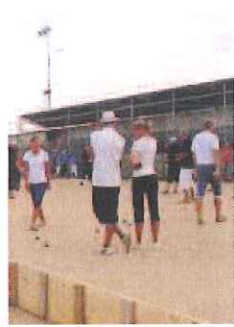
Uno dei match dell'europeo in corso