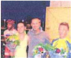
Il podio con i vincitori