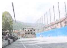
Pieves capitale del balon giovanile