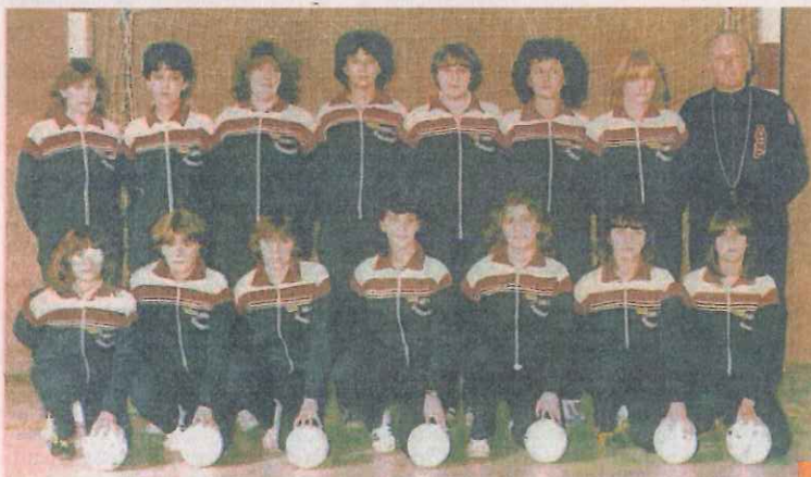
La gloriosa formazione femminile dell'Abc Bordighera che militò in Serie A negli anni '70

E' un'iniziativa ambiziosa che non si è limitata solo alle parole. Sia pure a livello sperimentale gli allenamenti delle ragazze (per ora sono poco più di una decina) sono già fissati, a cadenza settimanale, al giovedì, nella vecchia palestra Conrieri di via Pelloux, teatro,