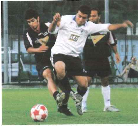
Un'azione di gioco durante il torneo dell'anno scorso

I gironi eliminatori dureranno lo spazio di 12 serate e termineranno venerdì 13 luglio. I gruppi degli