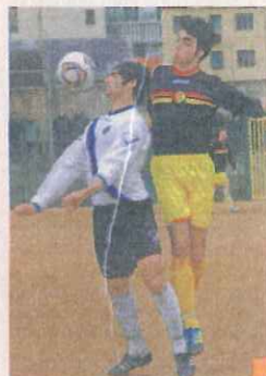
Continua il sogno Carlin's

Nell'eventuale finale la vincente tra Carlin's e Amicizia Lagaccio sfiderà chi avrà avuto la meglio tra Rivarolese e Don Bosco Spezia.