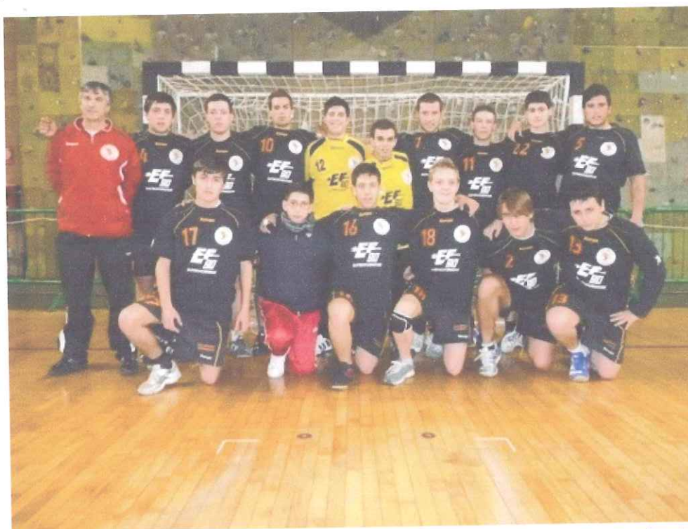
Sport Club Ventimiglia

Causa impossibilità di partecipazione di una società le gare di finale del 6 maggio hanno seguito alcune variazioni