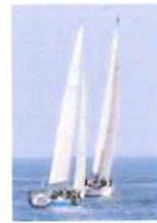
Imbarcazioni in gara

Al volte i primi equipaggi sono tornati nella zona Darsena di Arma di Taggia attorno alla mezzanotte