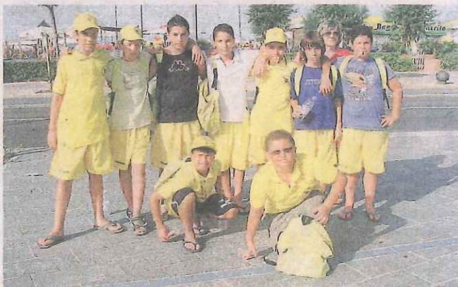
Gli Esordienti dell'Abc Bordighera, quarti al campionato italiano