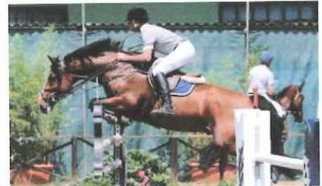
Lo spettacolo non è mancato nell'impianto matuziano