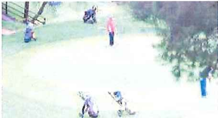
Il "green" del Golf degli Ulivi di Sanremo

Oggi si giocherà il "Trofeo Falconeri Sanremo" una 18 buche stableford in tre categorie. Domenica 11 marzo si