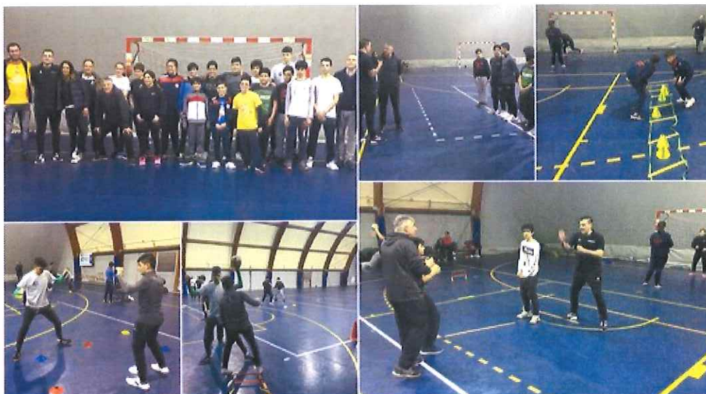
Grande successo a Ventimiglia per l'attività sui giovani portieri

Hanno partecipato 16 portieri dai 12 ai 17 anni delle quattro formazioni imperiesi