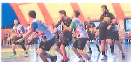
Il Ventimiglia rimane in fondo alla classifica

squadra non è stata in grado di esprimersi sui livelli della settimana precedente quando, in casa riuscì a conquistare, ai danni del Cassano Magnago, i primi due punti della stagione. Le assenze hanno pesato indiscutibilmente sull'economia del nostro gioco, ma questo non basta a giustificare una prova totalmente incolore. Nei prossimi giorni proveremo a recuperare qualcosa almeno sotto il profilo dell'umiltà e del gioco. Ora ci aspetta una serie di gare che potremmo definire alla nostra portata (la prima, il prossimo 10 marzo, in casa, contro il Ferrarin, poi di seguito: Selargius e Leno