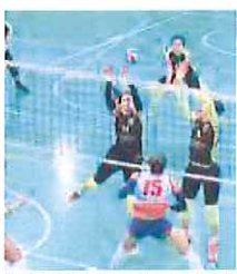
Anche le ragazze hanno perso