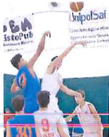
Il Vado sfiderà il Cus Genova

la grande rimonta. Tornano in scena anche i Campionati dipartimentali francesi. Dopo la lunga pausa, per il torneo seniors maschile, poule Pre-Excellence, l'Abc Bordighera ospita oggi alle 9,30 al PalaBiancheri la forte compagine del Monaco, nel confronto di recupero valido per la terza giornata. La società biancorossa chiede ai propri giocatori una vera prova di carattere, per contrastare un avversario di grande spessore. Ancora ferma invece la Poule Honneur, che vede impegnato il Team Schiavetti e che riprenderà sabato prossimo, con la trasferta dei rossoblù a Mentone. [G.C.]