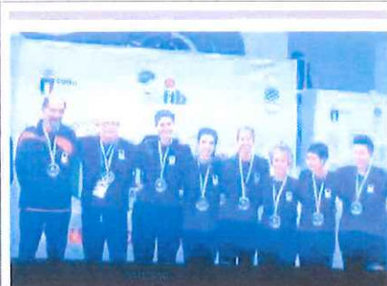
La squadra di Carcare sul secondo gradino del podio ad Alassio