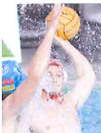
Damonte partirà verso Atene

A rendere bella la vigilia della sfida - la Rari è partita