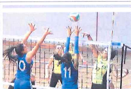
Le ragazze dell'Amadeo: 3-1 alla Normac, consolidano il 4° posto

■ En-plein per la Bocciola San Giacomo Imperia che, dopo aver conquistato l'ammissione diretta alla finale scudetto maschile, vede anche le ragazze, peraltro campionesse in carica, «bypassare» lo scoglio della semifinale e centrare il lasciapassare per la sfida decisiva, nella quale affronteranno la vincente del playoff tra Valle Maira e Abg. Ultimo turno di A ha visto le imperiesi vincere 14-4 sul Dff Ventimiglia; vittoria anche per la Valle Maira, 12-0 sul retrocesso Il Lantermino Pegli. L'Abg Genova invece si è fatta sorprendere per 12-6 dalla Caragliese. In coda il successo del Pontedassio per 10-8 sul Cp Sampierdarena consegna la salvezza agli imperiesi e manda i genovesi al playoff con la Caragliese. Classifica finale: S. Giacomo p. 19; V. Maira 15; Abg 13; Pontedassio, Dff Ventim. e Sampierdarena 9; Caragliese 6; Il Lantermino 3. [G.C.]