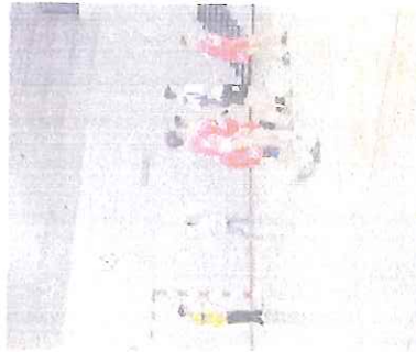
GLI UNDER 15 saranno a Imperia