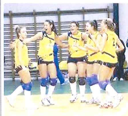
L'Iglina cerca un successo determinante sulla Prochimica Biella