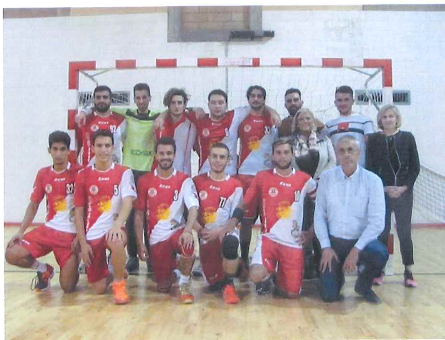
Nella foto la Seniores dell'ABC Bordighera

Doppio grande appuntamento al PalaBiancheri