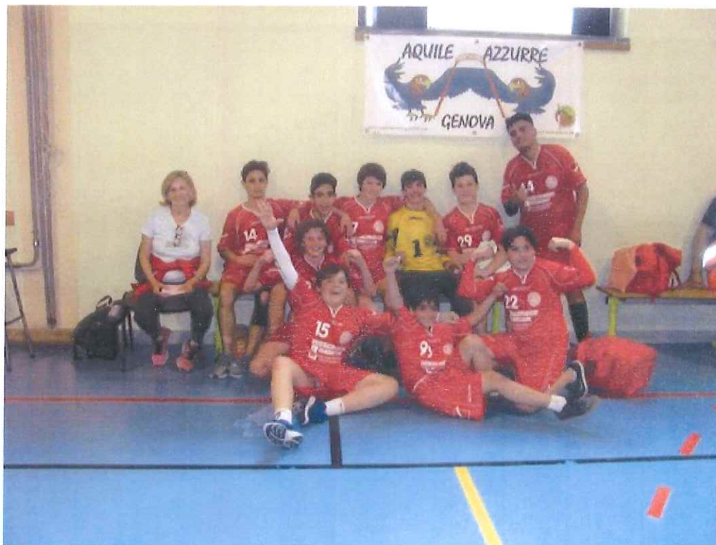
L'ABC Bordighera targata under 15

Per i neo campioni liguri sfida decisiva a Nizza contro i pari età del Cavigal. La Seniores si Giribaldi in campo mercoledì alle ore 20.30 in casa contro l'ASBTP Nizza