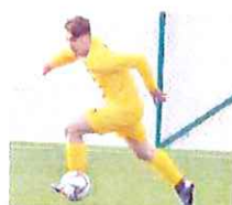
Metalla negli Juniores vadesi