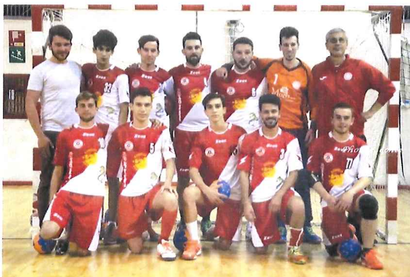
La Seniores dell'ABC Bordighera