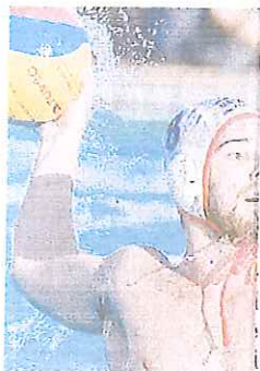
Guimaraes non è al me

ella i di ca- alla ntia :al- ro- , la sen- iori con to- itch ran par- mo, par- fatti pel- o di ino. Non ioni tmo stin- ceni- ni la Gio- che Flo- ce e fatto rtite gio- nei alla è a Ra- tcora oboa anco- re le di fa- Final anco- erato