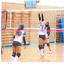
Bordivolley finalista in «Prima»