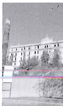
L'ex hotel Angst

condizioni, i medici ne hanno disposto l'immediato trasferimento a bordo di un mezzo dell'elisoccorso proveniente da Cuneo presso il nosocomio "Santa Corona" di Pietra Ligure dove ancora l'uomo è ricoverato. La prognosi è riservata ma l'operaio, in serata raggiunto dal responsabile di cantiere della sua ditta, secondo i medici, non verserebbe in pericolo di vita. Tutto è accaduto in pochi minuti, intorno alle 16.30 di ieri. L'uomo stava lavorando sopra ad un'impalcatura quando, forse per aver messo un piede in fallo, forse un malore, è caduto nel vuoto. I soccorsi sono stati