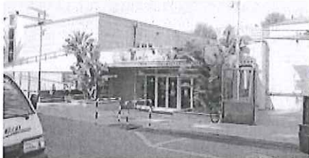
La struttura polisportiva di Bordighera in via Diaz

L'impresa sportiva non aveva rispettato i criteri imposti dal capitolato. Non era in possesso del requisito di capacità economico-finanziaria richiesto (il fatturato nel triennio 2014/2016 avrebbe dovuto ammontare a 450 mila euro), e