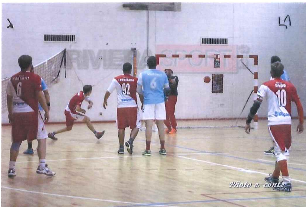
Sconfitta beffa per l'ABC Bordighera contro il Mentone

I biancorossi vengono sconfitti sul parquet di casa per 26-27: decide un tiro di rigore a tempo scaduto