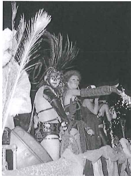
La Notte rosa di Bordighera