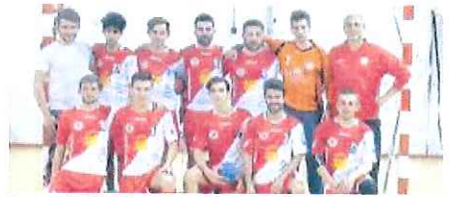
La rosa dell'Abc Bordighera