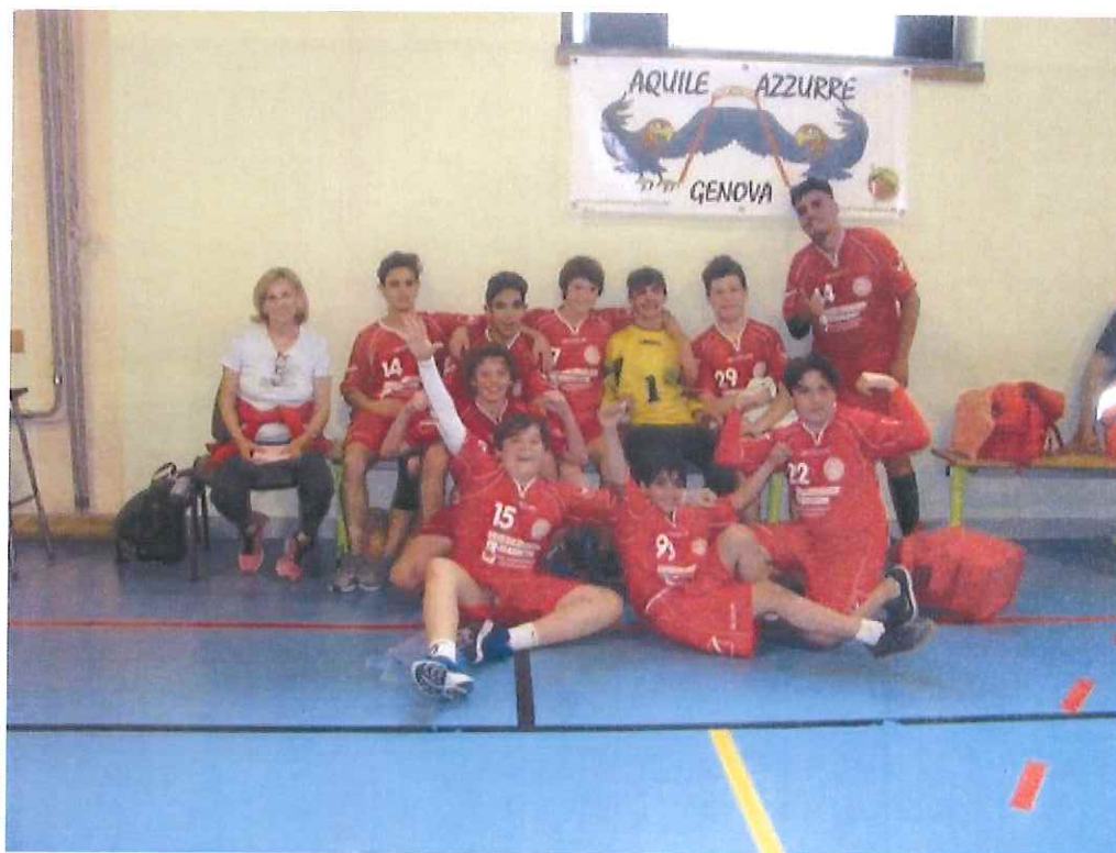
L'ABC Bordighera under 15 è Campione Regionale