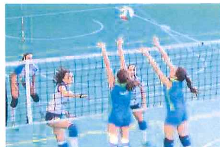
Un "muro" delle verdeazzurre dell'Nlp Chic Mazzu