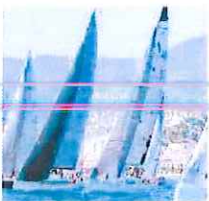
Le barche in azione a Sanremo

Fine settimana conclusiva all'insegna dello spettacolo per «Inverno in Regata», la terza tappa del 34° West Liguria, il Campionato invernale organizzato dallo Yacht Club Sanremo, con il supporto del Comune di Sanremo. Sabato e domenica si sono disputate due prove, entrambe su un percorso a bastone e caratterizzate da venti rispettivamente di circa 20 nodi da nord est e da 7 nodi da sud ovest.