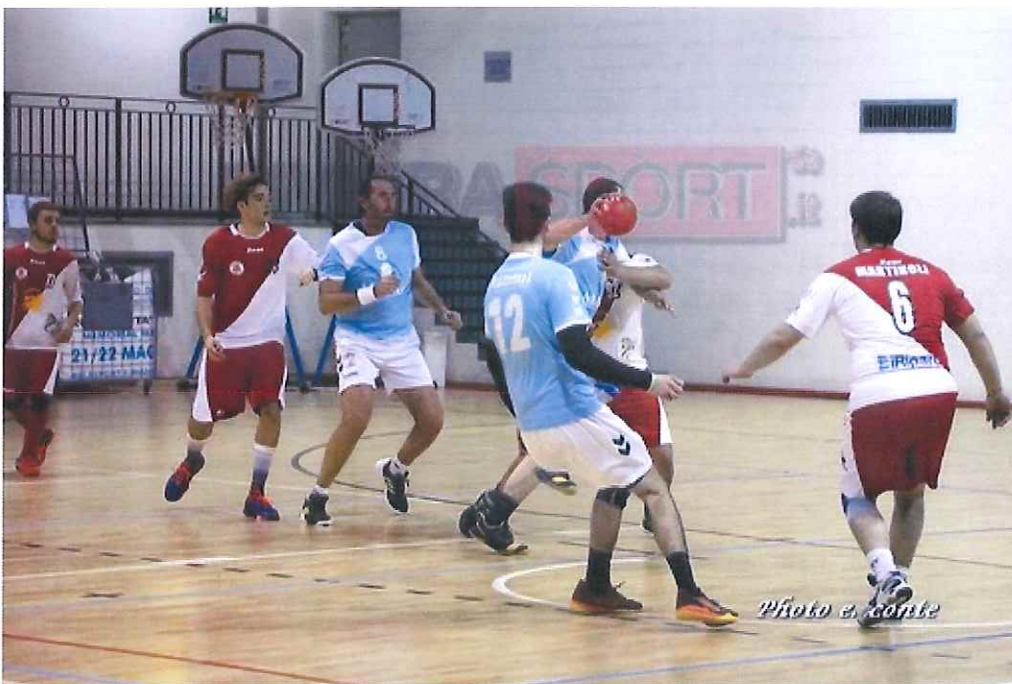
Pronta la ripresa per l'ABC Bordighera