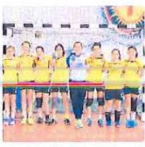
Le Under 17 del Team Schiavetti