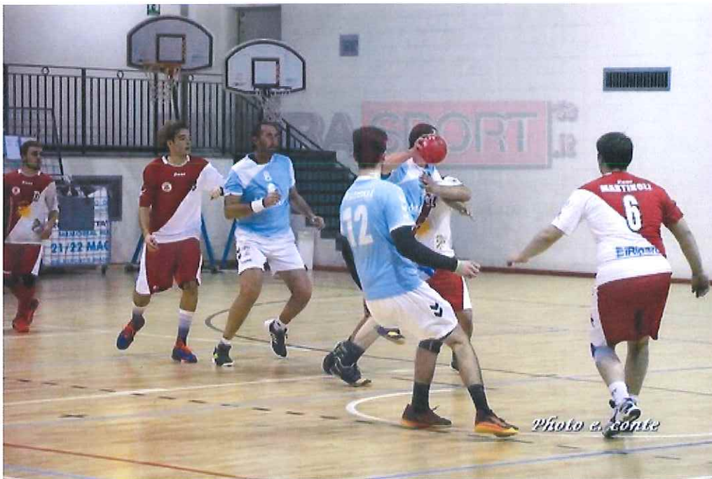
La Seniores dell'ABC Bordighera in campo sabato sera contro il Vallis Aurea

Appuntamento sabato ore 19.,30 al Pala Biancheri. In campo anche gli under 15 a Cannes domenica pomeriggio