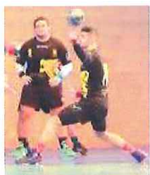
Gialloneri in lotta per salvarsi