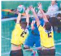
“Grafiche” a muro