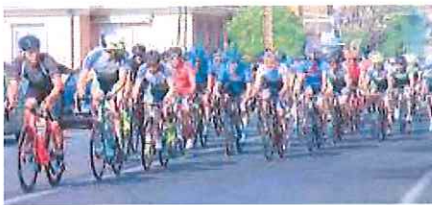
Cresce l'attesa per la Sanremo-Sanremo di metà marzo

La prima parte sarà congiunta, porterà i partecipanti prima a Ospedaletti, Bordighera e Camposso, poi in val Nervia tra Dolceacqua, Isolabona e Apricale, e in valle Argentina attraverso Vignai, Badalucco e Taggia. I percorsi si divideranno con il medio che si dirigerà subito verso il traguardo fissato in cima al leggendario Poggio, mentre il lungo concederà ai partecipanti anche l'emozione di un'altra salita mitica della Milano-Sanremo dei profes-