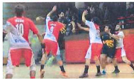
I biancorossi dell’Abc tornano domani in campo