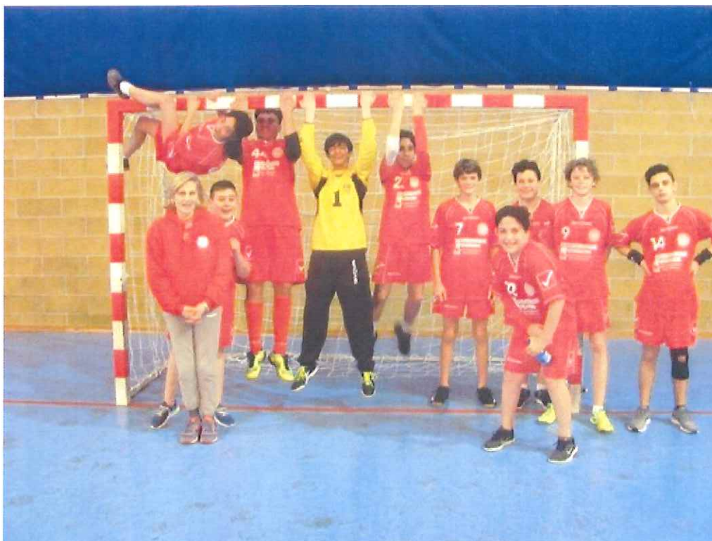
L'ABC Bordighera targata under 15 sogna nel campionato francese di categoria

Al Pala Biancheri arrivano i transalpini dell'OGC Nizza per i quarti di finale: match da dentro o fuori (ore 16.00). Sabato in campo anche la Seniores di Giribaldi sul parquet del Vallis Aurea