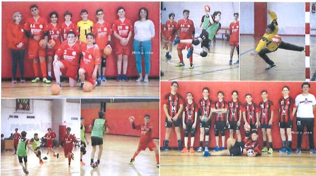
Grande vittoria dell'ABC Bordighera targata under 15 contro i pari età del Nizza