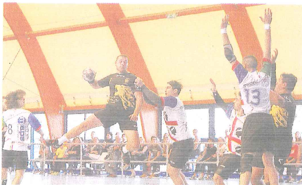
Il team del Ventimiglia in un'azione d'attacco