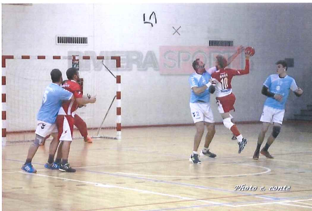
La Seniores dell'ABC Bordighera torna in campo sabato contro il Mentone

Fine settimana intenso al PalaBiancheri, dove l' ABC Bordighera scenderà in campo sul parquet di casa con match molto impegnativi: ecco l'agenda della compagine biancorossa. Sabato alle 19.30 la seniores maschile di Gigi Giribaldi ospiterà i francesi del Mentone, seconda in classifica, per il recupero della partita più volte rinviata e valida per il campionato dipartimentale francese della 2a Fase Pre-eccellenza PETM.