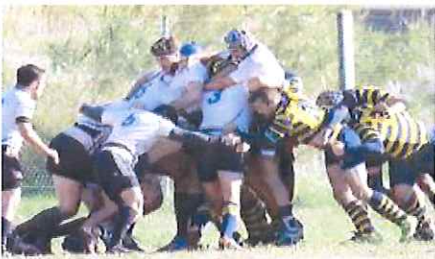
L'Union Riviera in campo

In campo il Cogoleto ha giocato con onore e ha messo a segno tre punti dalla piazzola, ma ha subito quattro mete in mezz'ora. Risultato: 29 a 3 a favore del team ponentino. Poi, al 30' del primo tempo, partita sospesa a causa della mancanza di "numero legale" di giocatori ospiti