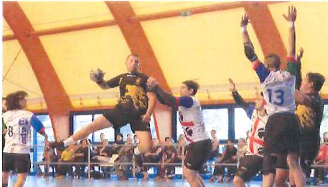
Il team del Ventimiglia in un'azione d'attacco