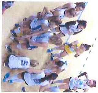
L'iglina difende il quarto posto

Scivolata ormai a sette punti dalla terza piazza della B2 femminile, l'Iglina Albsola prova almeno a conservare una quarta piazza che, qualunque fuori dai playoff, rappresenta comunque un traguardo prestigioso. Oggi alle 21 le ragazze di Matteo Zanoni sono a Busto Arsizio, ospiti della Unet E-Work che, con il suo decimo posto, è ormai quasi certa della salvezza. Il contemporeo proibitivo confronto del Lingotto Torino con la capolista Futura Busto Arsizio dovrebbe tenere le torinesi, attualmente quinte, lontane dalle albsolesi.