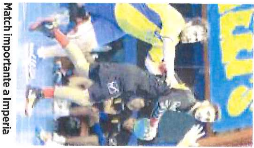
Match importante a Imperia