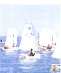
Regata di Classe Optimist

mento internazionale anche quest'anno vedrà i partecipanti divisi in due categorie: Cadetti (nati dal 2004 al 2006) e Juniores (nati dal 2000 al 2003). Il regolamento prevede nove regate (tre al giorno) con uno scarto dopo aver completato la quinta prova. Il segnale di partenza sarà dato lunedì 28 dicembre alle 11.55. Le prove successive sono in programma martedì 29 e mercoledì 30. In palio ci sarà anche il "Trofeo Dino Minaglia" che si propone di