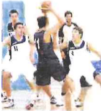
Imperia in azione difensiva

Nello scontro diretto tra le deluse, miglior sorte tocca all'Amatori. I savonesi espugnano per 77-65 il PalaBiancheri e, mentre riagganciano la