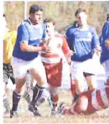
L'Union Riviera bene in serie C

io, per far fare loro esperienza in prima squadra». Con questo successo il Cus continua a rimanere imbattuto. Negli altri incontri, da segnalare che gli impietosi dell'Union Rugby Riviera sono andati a vincere