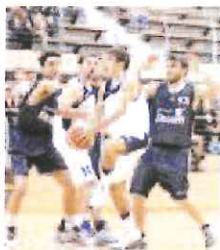
Riviera alla "Maggi"

mani alle 18 nella palestra Maggi. Impegno casalingo anche per la Rari Nantes Bordighera, la vittoria è d'obbligo alle 19 di domani contro l'Amatori Savona dopo la sconfitta a Genova con il Pegli.