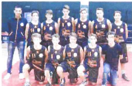
La squadra Under 15 dell'Ospedaletti è stata battuta dall'Imperia

È andato invece all'Imperia, 77-61, il derby con lo stesso Bc Ospedaletti valido per la sesta giornata Under 15. Nessuno dei due coach è però rimasto soddisfatto pienamente del gioco della propria squadra. «Al di là della vittoria - ha detto il tecnico imperiese Archimede - abbiamo sicuramente fatto un passo indietro rispetto alla gara precedente. I canestri sono arrivati più su iniziative dei singoli che dal gioco di squadra e