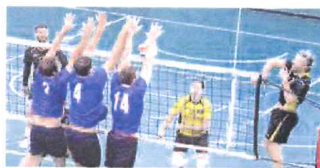
"Grafiche" impegnate in casa contro l'Admo Lavagna