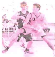
Gli Orange in azione