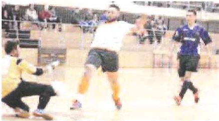
Una fase del derby Imperia-Ospedaletti

Tornando alla sfida di questa sera, i nerazzurri, privi