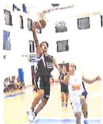
L'Albenga è capolista in serie D