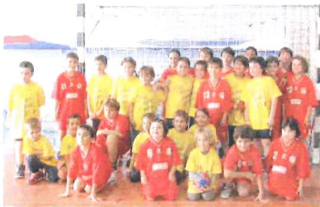
I giovanissimi atleti di Imperia e Bordighera: sport e divertimento domenica al PalaSanCamillo

negativi, invece, per le varie formazioni giovanili maggiori. Nulla da fare, nonostante l'impegno, per l'Under 18 dell'Abc Bordighera, sconfitta 33-15 a Nizza dalla squadra composta dalla selezione dei club nizzardi dell'Ogc e dell'Asbtp. Il passivo, troppo alto rispetto ai reali valori in campo, è stato condizionato dal disastroso avvio (7-0 per i francesi) e dalla maggior età e prestanza fisica dei rivali.