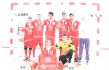
La squadra Under 18 dell'Abc Bordighera è passata a Mandelieu