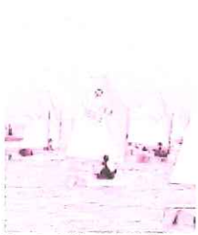
Regata di Classe Optimist

mento internazionale anche quest'anno vedrà i partecipanti divisi in due categorie: Cadetti (nati dal 2004 al 2006) e Juniores (nati dal 2000 al 2003). Il regolamento prevede nove regate (tre al giorno) con uno scarto dopo aver completato la quinta prova. Il segnale di partenza sarà dato lunedì 28 dicembre alle 11.55. Le prove successive sono in programma martedì 29 e mercoledì 30. In palio ci sarà anche il "Trofeo Dinomaniglia" che si propone di