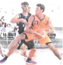
Gli Orange in azione