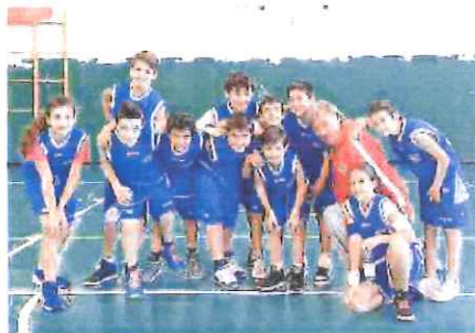
Gli Aquilotti del Sea Basket Sanremo emergono a livello Under 13