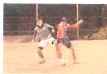
L'Airole in maglia verde

Imponendosi per 9 a 4 sull'Airole nell'ultima delle gare in calendario della prima fase del torneo, i biancorossi hanno confermato la propria leadership in vetta alla classifica e dopo aver goduto del meritato riposo, conseguente alla pausa festiva, torneranno in campo per la disputa della Coppa Italia e della seconda e più impegnativa