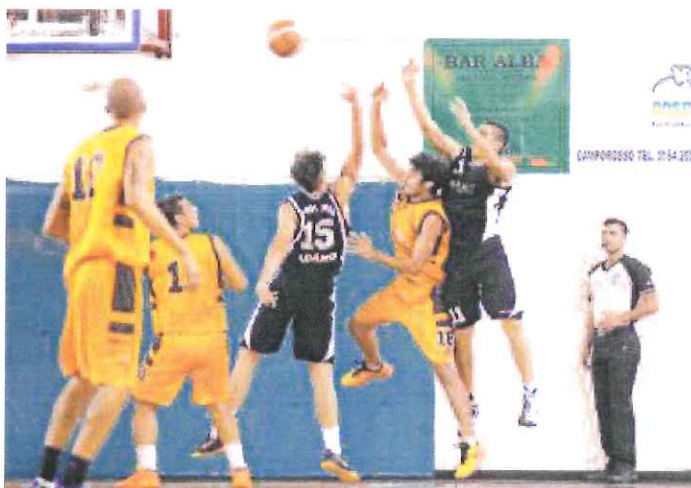
L'Ospedaletti di Lupi ha un'occasione d'oro per scalare la classifica

Serie D maschile. L'Imperia Riviera dei fiori, attualmente quarta, riceve la Pro Recco do-