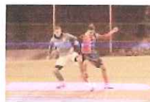
L'Airole in maglia verde

Imponendosi per 9 a 4 sull'Airole nell'ultima delle gare in calendario della prima fase del torneo, i biancorossi hanno confermato la propria leadership in vetta alla classifica e dopo aver goduto del meritato riposo, conseguiranno in campo per la disputa della Coppa Italia e della seconda e più impegnativa