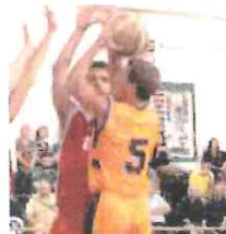
L'Ospedaletti a Sestri Levante

Occhi puntati anche su Vado, dove domani alle 18 l'Amatori Savona ospiterà nel Pallone Geodetico l'ambiziosa Albenga. Match interno, oggi alle 18,30 al Palasport, per la