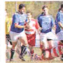
L'Union Riviera Rugby in azione

Sconfitta in trasferta invece l'Union Rugby Riviera. Gli imperiesi sono stati battuti a Genova (29-15) dal Cogoleto, che in virtù di questo successo aggancia in vetta il Cus Savona. Ora, domenica alla Fon-