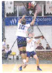
Lo Spinnaker gioca a Varese

In C femminile spicca, questa sera alle 19,30, il big match tra la capolista Spezia Autorey (15 punti in sei partite) e la Ch4 Caldaie Albenga, terza a soli tre punti dalla prima e, soprattutto, con una partita in meno. Altro confronto di rilievo è quello che alla stessa ora vede la Maurina Strescino Imperia ospitare al PalaRuffi-