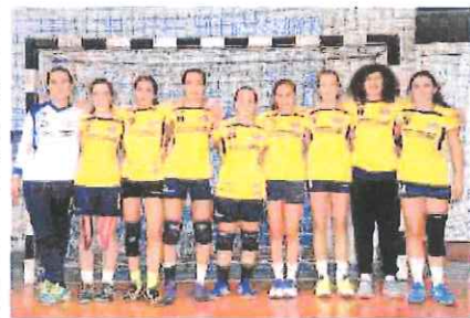
L'Under 16 del Team Schiavetti Imperia che ha travolto il Cavigal

Si è disputata la quarta giornata del 5° Torneo Ceci Von Mayer, organizzato dalla Matuziana Sanremo sul campo «Pian dei Cavalieri». Incontro principale era la sfida al vertice che ha visto il Ristorante Pagoda/Dima Point sconfiggere per 2-1 la Oro Cashmere. In vetta rimangono, a punteggio pieno, anche la Red Devil, grazie al 5-2 sulla Fc Crocierissime, e la Mf Sport, che si è imposta per 6-4 sul Bar Capriolo. Questi gli altri risultati: Borgo-Fc Sandy 2-3, La Sicilianese-Spantegai 7-5, Real Villetta-Circolo Carlin's 5-7; rinviata San Bartolomeo-Fratelli Diurno. Classifica: Red Devil, Ristorante Pagoda/Dima Point e Mf Sport p. 12; Oro Cashmere e Circolo Carlin's 9; Fc Crocierissime e La Sicilianese 6; Fc Sandy 4; Spantegai, Borgo, e Fratelli Diurno 3; Real Villetta 1; Bar Capriolo e San Bartolomeo Gozo 0. San Bartolomeo e Fratelli Diurno una partita in meno. [G.C.]