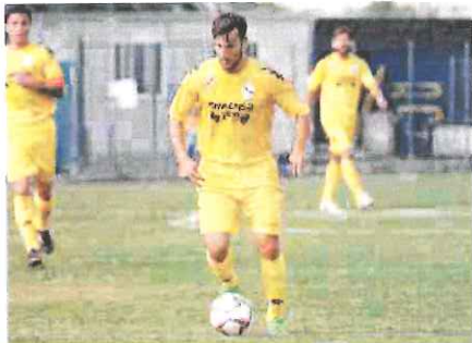
Lo Bosco ha realizzato la terza rete nel successo di Borgosesia

«Abbiamo disputato una grande prova in una bellissima partita - conferma il tecnico alla sua prima stagione ad