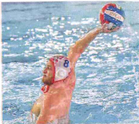
Milakovic ieri sera tra i più in vista nella Rari contro il Trieste

La marcatore del momento 6-6 firmato da Guimaraes è stato prima annullato e poi convalidato. L'arbitro Fusco sembrava in un primo momento aver assegnato espulsione contro la Rari salvo poi