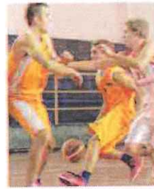
L'Ospedaletti gioca a La Spezia