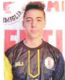
Vittorio del Ventimiglia Under 18

Diverse le gare che hanno visto impegnate le compagini dell'Abc Bordighera. Sul nuovo fondo in parquet che l'amministrazione comunale bordighera ha realizzato al PalaBlancheri la giovanissima Under 18 biancorossa (in realtà tutti ragazzi al di sotto dei 17 anni) ha esordito in campio-