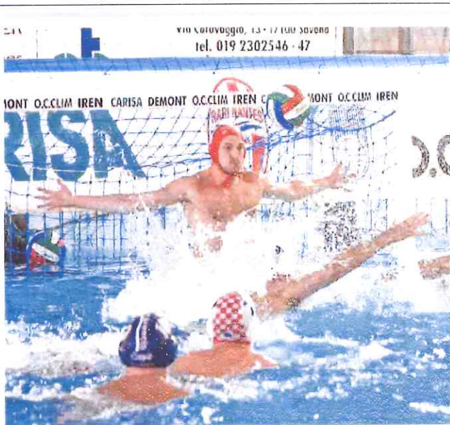
Nella foto d'archivio una parata di Antona, tra i protagonisti nel match di ieri sera della Rari a Sori

BUONE NOTIZIE DALL'ANTICIPO DELLA PALLANUOTO