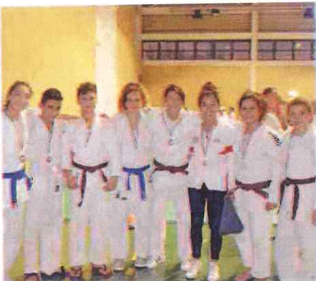
Ecco gli otto Esordienti campioni regionali dell'Ok Club Imperia