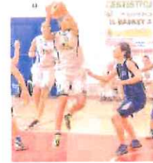
La Cestistica adesso è seconda