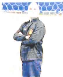
Zafarana tecnico intemelio

A riportare lo sport in primo piano sarà il derby tra Abc Bordighera e Team Schiavetti San Camillo Imperia che, per il campionato Senior maschile, va in scena stasera alle 21 al PalaBiancheri. Un confronto che, anche se vissuto in un contesto francese, rappresenta sempre un appuntamento sentitissimo in provincia, tra società che hanno scritto la storia della pallamano ponentina. Nonostante la collaborazione avviata quest'anno tra le due società, che hanno allestito un'unica prima squadra femminile, il derby è sempre il