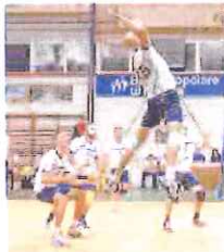
Per lo Spinnaker 3-0 su Milano

Domenica amara, invece, per le due ponentine scese in campo nella C maschile. Tan-