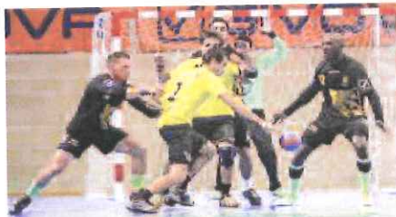
Il Ventimiglia in fase difensiva