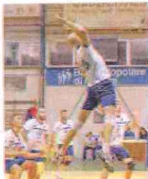
Lo Spinnaker domani a Cuneo

In ambito regionale, praticamente tutti i campionati hanno vissuto, tra martedì e giovedì, diversi anticipi. Per effetto di ciò sarà un fine settimana talora a programma ridotto, come in C maschile dove per la seconda giornata l'Avio Finale ha vinto 3-2 in rimonta ai danni di una Grafiche Amadeo furente per i presunti torti arbitrali subiti. Oggi alle 21 al PalaVolley di via Molinero a Savona la Planet riceve il Cus Genova, mentre domani alla palestra Ruffini, stante l'indisponibilità di quella dell'Itis, il Primavera Imperia attenderà lo Spezia. Per la C femminile, dopo l'agevole vittoria di mercoledì dell'Acqua Minerale Calizzano Carcare per 3-0 sulla But-