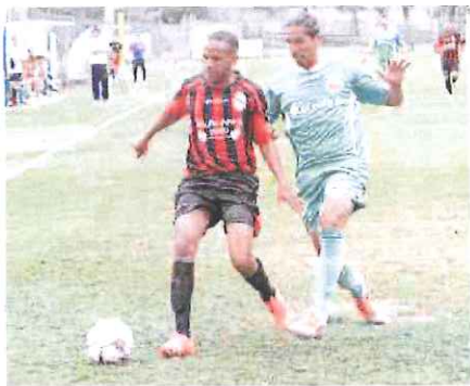
El Khayari pareva avere mercato, ma l'Argentina ha tenuto duro

Sulla base di giovani che l'anno scorso erano stati lanciati nella prima squadra sono un'autentica folla i nuovi giocatori che il tecnico Fabio Fossati sarà chiamato ad amalgamare in tempi relativamente brevi, con lo scopo di costruire una formazione in grado di lottare per i playoff. Oltre ai due