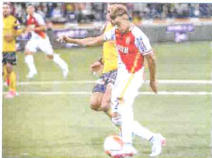
El Shaarawy a Berna: l'ex milanista ha sfiorato il gol nel finale

Nel calcio ogni partita fa storia a sé e le sorprese possono essere sempre dietro l'angolo,