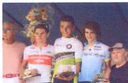
Il podio di Borgomanero con i due atleti ponentini