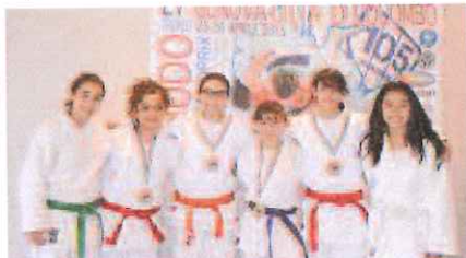
Le ragazze dell'Ok Club Imperia