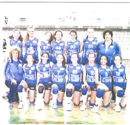
La Pizzeria El Billi Nlp Sanremo, campione provinciale Under 14