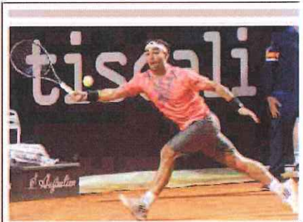
Fognini nel vittorioso match con Johnson: oggi avrà Dimitrov