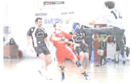
Un'azione dell'Abc Bordighera