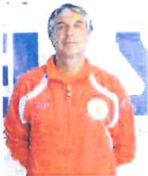
Malatino; «anima» del club

E ora si tratta solo di incrociare le dita e poi, per la Pallamano Ventimiglia, potrebbe addirittura avverarsi il sogno della A1. Sabato sera, in un PalaRoja stracolmo e traboccante di tifo, nell'ultima giornata della Poule Promozione che chiudeva il lungo cammino dalle A2, i frontalieri sono riusciti a compiere l'impresa di sconfiggere per 28-27, la supercapolista Leno e di confermarci al secondo posto del girone. Promosso sicuramente è proprio il Leno ma il Ventimiglia, con la piazza d'onore e l'imminente riforma dei campionati predisposta dalla Federazione, potrebbe davvero ritrovarsi, l'anno prossimo, nella massima serie.