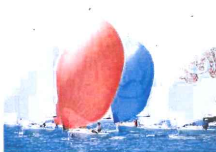
Una spettacolare fase delle regate sanremesi della classe J/70

Cinque, in totale, le prove disputate dai 25 equipaggi protagonisti della due giorni organizzata dallo Yacht Club Sanremo, un evento che segna la metà del campionato. Al termine delle regate, grazie a due vittorie parziali e con un quinto posto scartato come