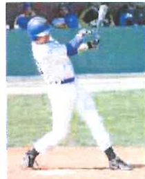
Il Sanremo Baseball al top in B

Questa la classifica dopo la prima giornata di ritorno: Cairese (12-4) 750; Sanremo (11-5) 687; Codogno e Settimo (10-6) 625; Rho (9-7) 562; Vercelli (6-10) 375; Novara (4-12) 250; Ares Milano 2-14 (125). [G.C.]