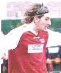
Tos quando era al Sant'hià

Sinergie in via di realizzazione anche con le altre società della zona. In particolare