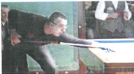
La "stecca" ha tanti appassionati nel Ponente

Gli imperiesi si sono piazzati quinti, in una classifica molto corta in particolare nelle posizioni medio-alte. A