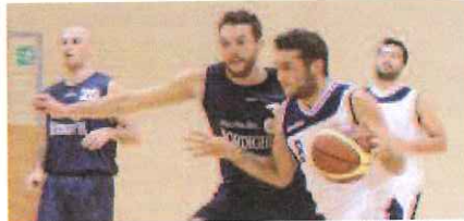
Grande gara per Rotomondo (Imperia), autore di 13 punti GIUSTO

Sempre in serie D maschile sconfitta per la Rari Nantes Bordighera, per 71-57, sul parquet di Ospedaletti con il Basket Albenga. «Abbiamo subito un'onorevole sconfitta - sostiene l'allenatore bor-