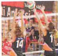
Battuta la leader Armataggia

Le dianesi infatti non hanno fallito e si sono imposte sul terreno amico del Pala-Caneipa con un netto 3-0 sulla Maurina Imperia. Piccolo balzo in classifica, nella lotta per il quarto posto, per la Sall'i's Ventimiglia, che ha superato per 3-1 le altre giovanissime dianesi, quelle della Simply Volley. Quando alla fine della stagione mancano ancora solo quattro partite si accende il duello tra le due capoliste, che si incontreranno una prima volta questa sera al PalaRuffini di Taggia e chiuderanno poi l'intero programma, con quella che potrebbe essere la sfida decisiva, il 6 giugno a Dianio Marina. Classifica: Armataggia Rossa e Arredamenti Anfossi Dianio p. 15; Nip Rosa Sanremo 12; Sall'i's Ventimiglia 6; Maurina Imperia 5; Simply Dianio 1.