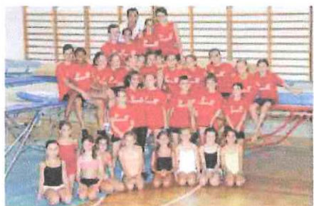
Il gruppo di specialisti di trampolino elastico della Riviera dei Fiori

Conferme al top per il club armese, tecnici impegnati nel summit federale