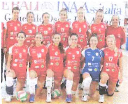
La Vta Ina Assitalia Taggia, finalista nel campionato regionale U18

Classifica: Autoc. Funivia Nlp Sanremo p. 40; Golfo di Diana 34; Via Bertaina Taggia 29; Maurina Bianca Imperia 23; Sallì's Ventimiglia 21 (3 punti di penalizzazione), Servizio Sanremo 7; Nlp Sanremo Azzurra 6; Maurina Bianca 4.