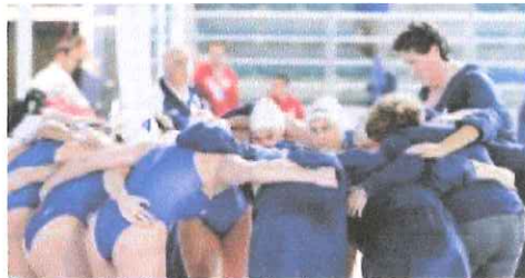
Il gruppo della Mediterranea prima di ogni gara