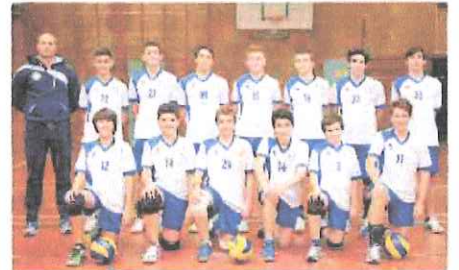
La squadra Under 15 della Sanremo Volley, campione provinciale

Anche per l'Under 15 si profila ora la fase interprovinciale, contro i savonesi della Sabazia Vado, per una sfida contro una delle grandi realtà del volley ligure. (G.C.)