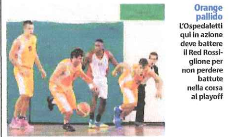
Orange pallido L'Ospedaletti qui in azione deve battere il Red Rossiglione per non perdere battute nella corsa ai playoff

Incontro di grande richiamo, per la C femminile, alle 21 di questa sera al Palasart. A sfidarsi, per l'ultima giornata della stagione, sono le padrone di casa del Bc Ospedaletti, squadra capolista, e le spezzine dell'Antares Romolo Magra, seconde a due punti. Entrambe sono già ammesse ai playoff ma lo scontro diretto servirà per stabilire il primato ed assegnare, in caso di necessità, il diritto a disputare sul proprio terreno l'eventuale bella nella finale che, al termine del tabellone ad eliminazione diretta, assegnerà la promozione in serie B. (G.C.)