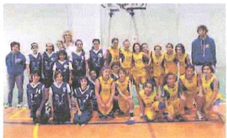
Foto di gruppo per le Esordienti del «Girrrls» Diano e dell'Allassio