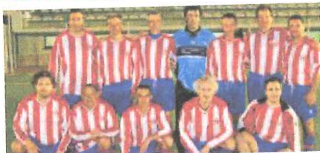
Una formazione del "Bordighera-Crosia", vittorioso contro il Sa Valtinèe