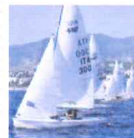
Il trofeo Jean Bertrand