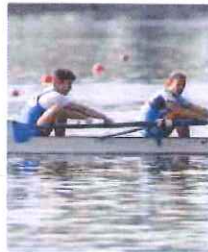
Torna il classico «Vacchino»

Torna oggi e domani, nello specchio acqueo interno al Porto Vecchio, il tradizionale Trofeo Aristide Vacchino, regata internazionale di canottaggio sprint riservata ad Allievi e Cadetti giunta alla sua 33a edizione. La manifestazione, organizzata dalla Canottieri Sanremo, è indetta dalla Federazione Italiana Canottaggio e realizzata con il patrocinio della Regione Liguria - Assessorato allo Sport - e del Comune di Sanremo, con la collaborazione del Coni e della Fondazione Carige.