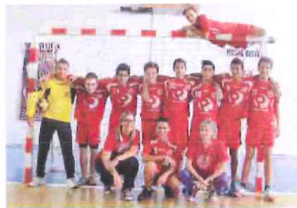
La squadra Under 16 dell'Abc Bordighera vittoriosa nel derby