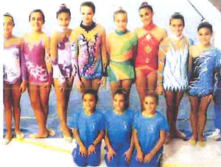
Il gruppo di atlete della Riviera dei Fiori impegnate in Francia

La giornata di competizioni, svoltasi in un palazzetto colorato con palloncini e bandiere delle due Nazioni, è stata un'esperienza emozionante per le giovani ginnaste della Riviera che, in generale, si sono ben comportate, eseguendo al meglio i difficili esercizi proposti dal programma. In considerazione anche dei prossimi impegni agonistici in