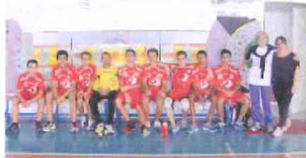
L'Under 16 dell'Abc, battuta a Imperia dopo un ottimo 1° tempo

«La squadra - ha detto il coach imperiese Roberto Lurigo - ha retto bene per tutti i