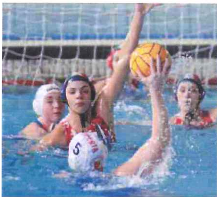
Mediterranea e Orizzonte tornano di fronte dopo le sfide passate

Ripartire subito, lasciandosi alle spalle i balbettii di Padova e giostrando da squadra campione contro un'avversaria comunque sempre quotata quale è l'Orizzonte Catania. Non ci sono altre strade, per la Mediterranea di Marco Capanna, nella settima giornata della A1 femminile di pallanuoto. Dopo lo stop subito in casa del Plebiscito, prima sconfitta in assoluto in questa stagione, e l'aver lasciato alle spalle anche il primo posto in classifica, le imperiesi devono subito ritrovare il loro gioco offensivo ficcante e veloce