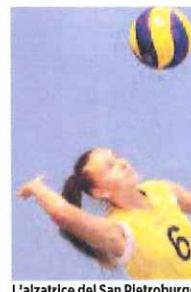
L'alzatrice del San Pietroburgo