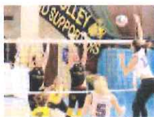
Grafiche Amadeo, esordio col botto