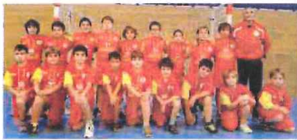
La U12 della Pallamano Ventimiglia ha vinto il Plateau Technique

Gran fine settimana per le giovanili ponentine. A sorridere è soprattutto la Pallamano Ventimiglia che ha messo a segno un esaltante tris. A firmarlo le formazioni Under 18 e Under 14, oltre alla Under 12 che ha fatto suo il Plateau Technique. Gli U14, dal canto loro, hanno superato lo Schiavetti Imperia per 29-13 mentre l'U18 non ha avuto intoppi, nella gara del campionato di-