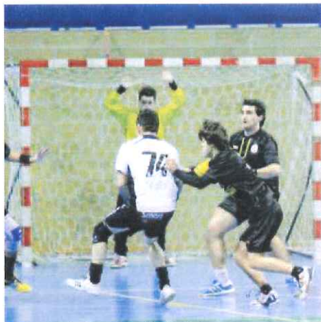
Per il Ventimiglia una stagione subito in salita