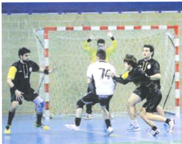
Lo Sport Club Ventimiglia

Sabato nel Principato di Monaco, present, anche il vertice societario del team bordigotto, si terrà presso lo stadio Louis II di Monaco una riunione organizzata dal Comitato francese delle Alpi Marittime nel-