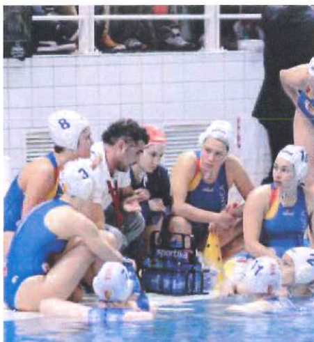
Coach Capanna non allenta la tensione