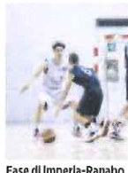
Fase di Imperia-Ranabo

Under 15. Successo di misura, per 49-48, dell'Imperia basket sul parquet del Basket Cairo. «Un finale non adatto ai deboli di cuore - dichiara il coach imperiese Archimede - nell'ultimo quarto i nostri ragazzi hanno messo in campo un grande cuore e la voglia di portare a casa la vittoria, ottenuta con un tiro libero a quattro secondi dal termine». A.B.