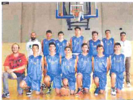
La formazione Under 17 del Bvc Sanremo ha battuto il Vado A