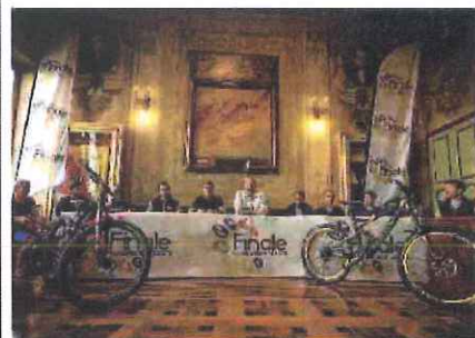
La conferenza di presentazione dell'Enduro World Series