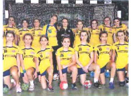
La sezione femminile del Team Schiavetti: talento e ambizioni

L'altro successo imperiese è stato firmato dalla Under 16 maschile che ha sconfitto i cugini del Ventimiglia