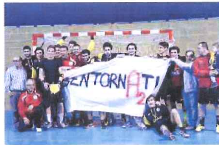
Dopo la festa dello scorso anno, il Ventimiglia torna in A2