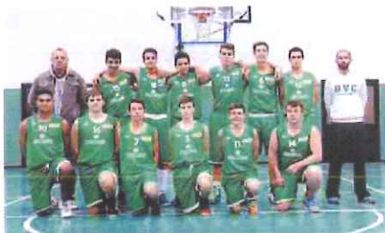
In cerca di gloria Dall'album della stagione passata, a destra gli Under 17 del Bc Ospedaletti, campioni regionali. Sopra l'U17 del Bvc Sanremo

All'Under 19 Regionale prenderanno parte ben quattro squadre ponentine, che si troveranno già le une di fronte alle altre nei