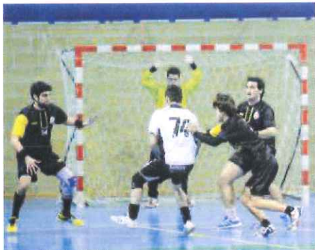
Lo Sport Club Ventimiglia