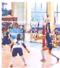
Tessitore verso i match decisivi

Sale la tensione a Villa Ormond per la 30a Sanremo Cup-Memorial Dado Tessitore, torneo internazionale che oggi pomeriggio manda in scena le semifinali (ore 15,15 e 17,30). La manifestazione, organizzata dalla Nlp Sanremo con il quotidiano La Stampa media partner, ha vissuto la prima serata di gare ieri, con la disputa delle qualificazioni, atte a stabilire i ben più importanti abbinamenti di oggi.