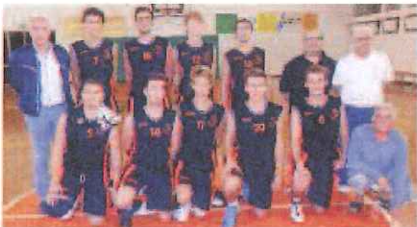
La squadra Under 19 del Bc Ospedaletti, capolista in campionato