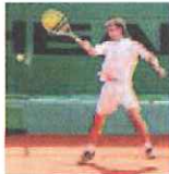
Un bel dritto