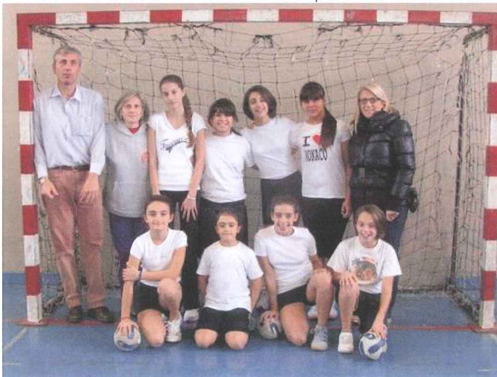
L'Under 14 dell'Abc Bordighera

Bordighera - La manifestazione prevede un susseguirsi, senza soluzione di continuità, di partite della durata di 20 minuti in modo da consentire a tutte le formazioni presenti di affrontarsi e misurarsi tra loro