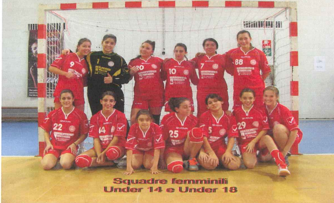
Squadre femminili Under 14 e Under 18