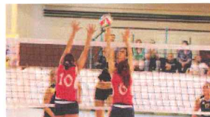
Grafiche Amadeo eliminata dalla Coppa Italia