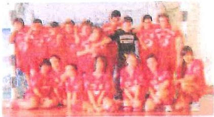
Foto di gruppo per ragazze e ragazzi Under 14 dell'Abc Bordighera

Alla competizione parteciperanno in totale otto squadre, tre formazioni Under 14 e cinque Under 16-18 che, nell'arco dell'intera giornata, si sfideranno in due minitornei. Saranno presenti le formazioni Under 14 e Under 18 delle due uniche società che in Liguria hanno squadre femminili, ossia la stessa Abc e la San Camillo Imperia, le Under 16 della Libertas Luserna (Torino) e della Pallamano Raluca di Cas-