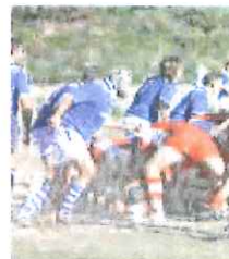
Imperiesi pronti a stupire

L'attività dell'Union Rugby è incostante e espansiva come dimostrano i contatti attuati recentemente nell'estremo ponente ligure che potrebbero portare allo sviluppo di un