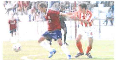
Cascina ha siglato il terzo gol del Bordighera