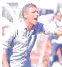
Tabbiani non cerca attenuanti

Anche mister Tabbiani riesce ad analizzare questa batosta con lucidità mista a preoc-