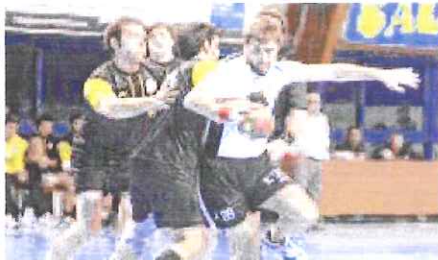
Il Ventimiglia vuole recitare un ruolo da protagonista GIUSTO