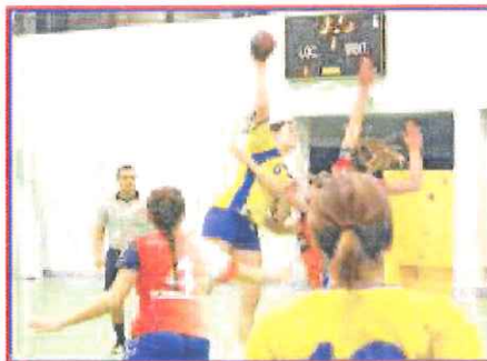
Le ragazze bordigolte-imperiesi a caccia del successo