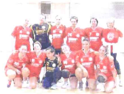
La nuova squadra seniores femminile della mista Abc/San Camillo