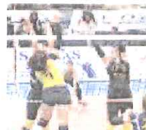
"Grafiche Amadeo" sotto rete